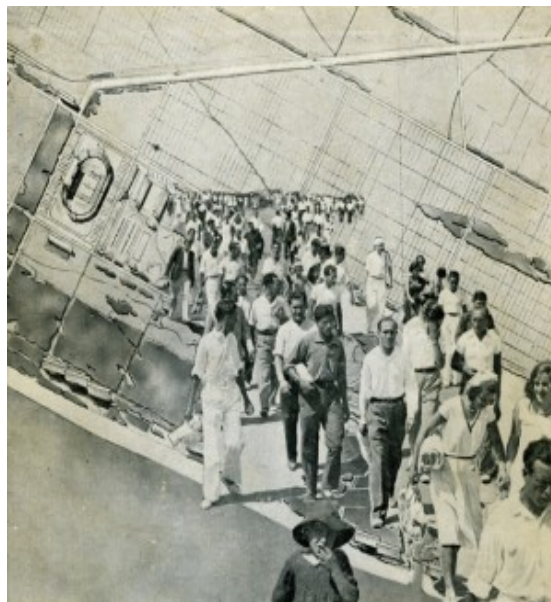
Fig. 1. Portada revista AC 7.

- Aislamiento agrícola, rodeando el área de vacaciones.”