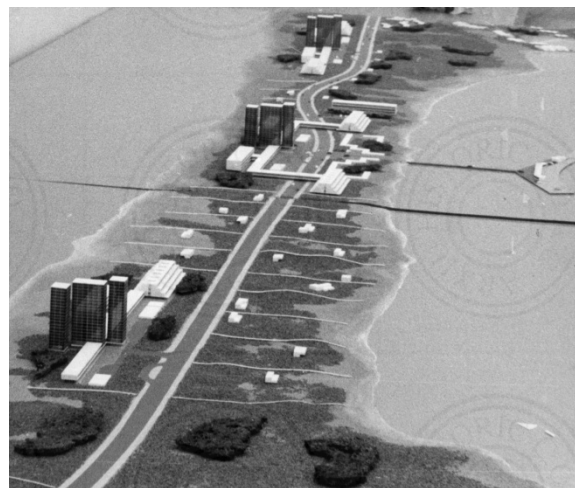
Fig. 3. Maqueta de La Manga del Mar Menor.

El Plan de La Manga se organiza en base a núcleos tipificados que se sitúan cada dos kilómetros del recorrido. El alejamiento entre estos núcleos permitía disfrutar del paisaje y sus valores y de las condiciones paradisiacas de la situación entre dos mares. Este distanciamiento garantizaba la preservación del paisaje existente y por tanto su valoración y conservación, convirtiéndose en un atractivo turístico de importante durabilidad en el tiempo. En el caso particular de La Manga, no queda más remedio que trazar una vía axial que recorre la lengua de tierra y que es único acceso y vía de tráfico dada la dimensión transversal del área. Es por esto por lo que insiste en que “ la vía principal –concebida como paseo– se traza de forma que no permita grandes velocidades y representa la columna vertebral de la ordenación. ” (Bonet, 1962: inédito, COAC C 1230/1).