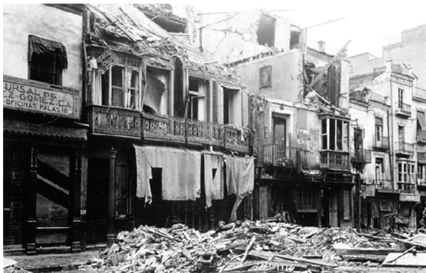
[Fig. 2]. CALLE DEL CARMEN DESPUÉS DE LOS BOMBARDEOS DE LA GUERRA CIVIL. www.regmurcia.com .

escombros, con calles, plazas, fábricas y edificios arrasados por completo [Fig. 2]. Los recursos de los que se disponía eran escasos, fue necesario emplear todos ellos para la recuperación de la ciudad, el puerto y la industria. Se construyeron nuevos muelles para recuperar la Base Naval y la actividad comercial del puerto. Se comenzó a sanear la ciudad, fueron derribados numerosos edificios en mal estado y se llevaron a cabo modificaciones en algunos sectores urbanos. Algunas de estas modificaciones fueron el ensanche de la Calle Campos o la alineación del conjunto formado por la plaza Castellini y las Puertas de Murcia.