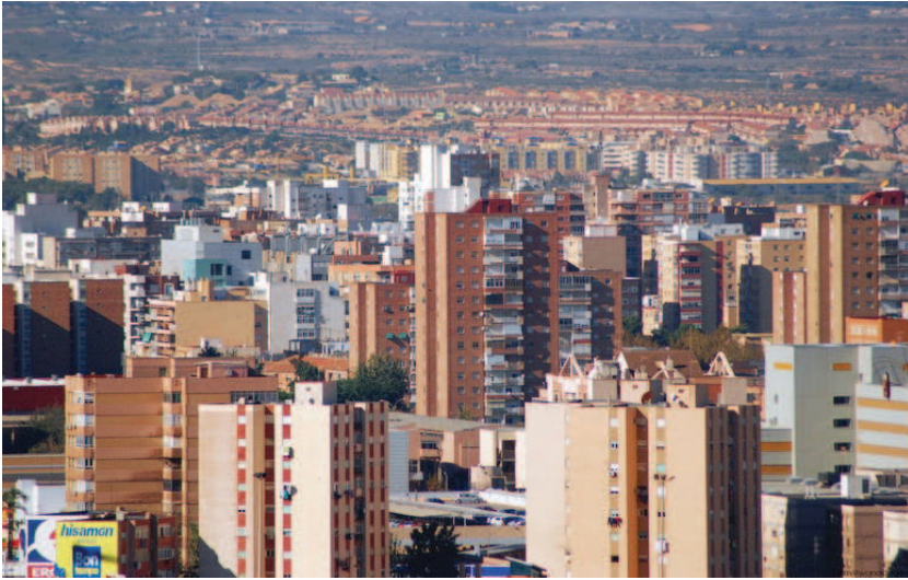
[Fig. 11]. ENSANCHE DE CARTAGENA EN LA ACTUALIDAD.

itectura ha supuesto desde entonces un punto de inflexión importante en el comportamiento social y económico. Ya las construcciones no se mueven por conseguir resultados más armónicos, por la calidad de los materiales, por el buen hacer, aunque ello suponga construir a un ritmo más lento; al contrario, cada vez más son los factores económicos los que priman.