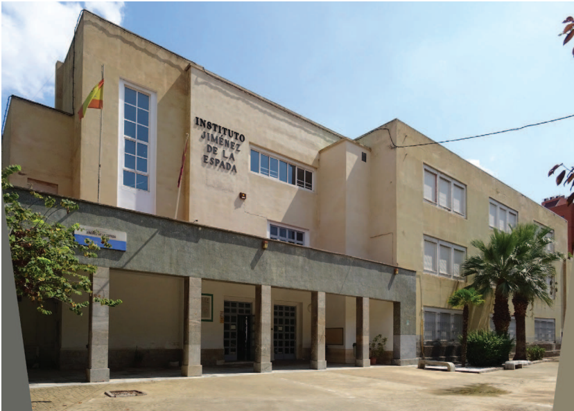
[Fig. 9]. INSTITUTO JIMÉNEZ DE LA ESPADA, PROYECTADO POR LORENZO ROS COSTA EN 1944.

mayor altura de los edificios y el aprovechamiento exhaustivo del volumen. Sin embargo, los materiales interiores y cerramientos perderán calidad y pondrán en evidencia su bajo costo. [Fig. 10]