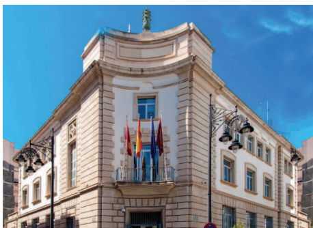
[Fig. 6]. MINISTERIO DE ECONOMÍA Y HACIENDA, PROYECTADO EN 1960.

que recorre todos sus muros y da lugar a “masas rotundas, volúmenes pesados y agobiantes” (Pérez Rojas, 1986: 461). La fachada principal de la mayoría de sus obras muestra equilibrio entre las formas y consigue producir una sensación armoniosa. La arquitectura de Ros es contradictoria y muy dibujada, como era frecuente entre los arquitectos de su tiempo. Ros entendía las bellas artes como un medio y una necesidad para la arquitectura; su dominio del dibujo le permitió casi siempre manifestar en sus obras la presencia de las artes.