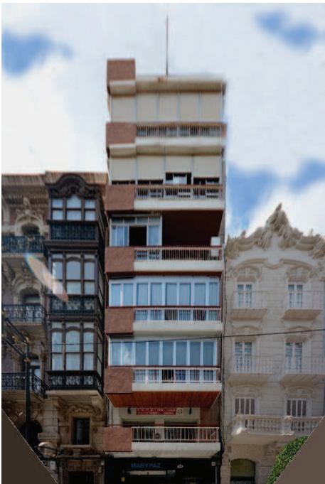
[Fig. 10]. EDIFICIO DE LA CALLE DEL CARMEN 53, PROYECTADO EN 1971.

A partir de los años 60, con la recuperación económica, se extendió, no sólo en Cartagena sino en toda España, una especie de necesidad de seguir construyendo sin descanso, con la justificación de la fuerte demanda de viviendas que existía; aunque lo cierto es que en realidad el objetivo principal perseguía el beneficio económico del constructor o promotor.