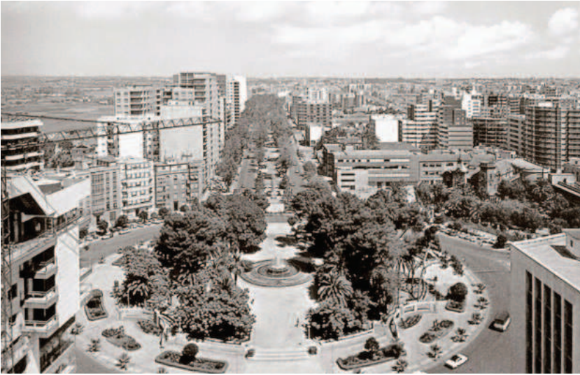
[Fig. 3]. PLAZA DE ESPAÑA Y ALAMEDA SAN ANTÓN EN LOS AÑOS 60. [CARTAGENA ANTIGUA.]

Las manzanas planteadas por el Proyecto de Ensanche eran cuadradas y rectangulares, ortogonales en su mayoría, aunque existen diferentes tipologías. Todas tenían un patio central abierto y numerosas zonas reservadas para el arbolado, aptas para contribuir a la desecación de los terrenos. Nada tiene que ver la trama urbana del casco antiguo con la planteada ahora por el nuevo ensanche. Contrastan así las pequeñas manzanas irregulares, con calles estrechas y entrelazadas, en las que sólo se distinguen las vías principales, propias de la ciudad antigua, en comparación con las cuadrículas que forman las nuevas manzanas, en las que las calles son anchas, rectas y dispuestas mediante un trazado en malla, con dos sentidos perpendiculares entre sí.