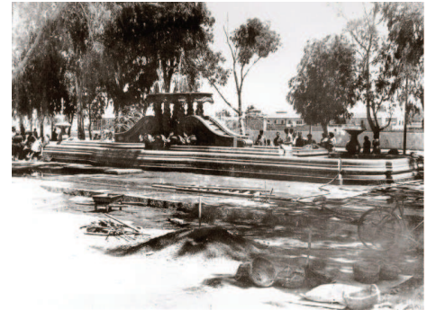
[Fig. 1]. FUENTE QUE SIMBOLIZA LA LLEGADA DE LAS AGUAS DE TAIBILLA. [CARTAGENA ANTIGUA]

Durante la guerra civil, fueron escasas las labores de urbanización llevadas a cabo. Una vez terminada la contienda, la población cartagenera se encontraba con una ciudad destrozada por los continuos bombardeos, llena de