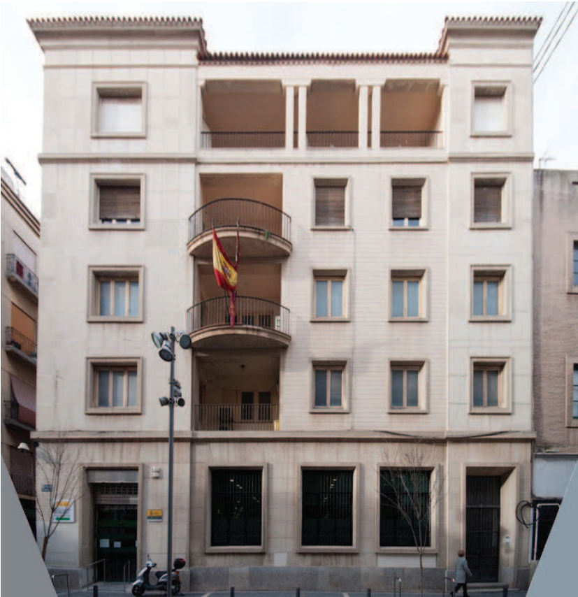
[Fig. 7]. EDIFICIO DE LA SEGURIDAD SOCIAL, PROYECTADO EN 1962.

proyecto de urbanización del Molinete. Otro proyecto a destacar fue el del Instituto de Enseñanza Media de Cartagena 'Jiménez de la Espada', donde Ros lleva a la práctica una forma de 'racionalismo' cercana a los años cuarenta.