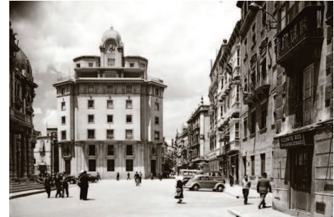
[Fig. 5]. PLAZA DEL AYUNTAMIENTO. AL FONDO, LA SEDE DE LA MANCOMUNIDAD DE LOS CANALES DE TAIBILLA. [CARTAGENA ANTIGUA]

Lorenzo Ros fue arquitecto municipal de Cartagena, nombrado en 1916, al mismo tiempo que Víctor Beltrí. Nació en Cartagena en 1880, en el seno de una familia catalana y en un ambiente de clase media acomodada. Al finalizar sus estudios, en 1914, trabajó como arquitecto municipal en Figueras, de donde provenía su familia. La arquitectura inicial de Lorenzo Ros mantiene el orden y simetría propios de una opción clasicista, en ocasiones acompañada por detalles de impronta barroca. Lorenzo Ros acostumbró a proponer en sus edificios una minuciosa ornamentación