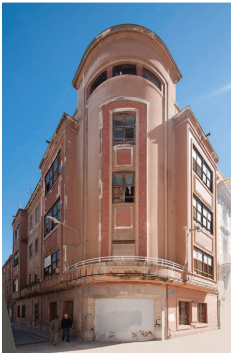
[Fig. 8]. AMPLIACIÓN CINE CENTRAL DE CARTAGENA, PROYECTADA POR LORENZO ROS COSTA EN 1945.

sobria pero elegante, escueta en materiales pero con ingeniosas soluciones. En Cartagena, los edificios del régimen se caracterizan por la jerarquización de las fachadas. Mientras que la planta baja suele estar más decorada, con basamentos, frontones y pequeñas ornamentaciones como escudos y figuras geométricas, los pisos superiores emplean una ornamentación más sencilla, remarcando únicamente los huecos de la fachada. En muchos casos se advierte la delimitación entre las plantas mediante las impostas que dividen la fachada.