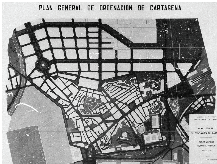
[Fig. 4]. PLANO DEL CASCO ANTIGUO Y EL ENSANCHE. PLAN GENERAL DE ORDENACIÓN DE CARTAGENA DE 1961.

En definitiva, durante los años de la posguerra la mayoría de las actuaciones se centraron en el casco antiguo, y será en los años posteriores cuando se lleven a cabo numerosas obras en el Ensanche, con el consiguiente crecimiento apresurado de la ciudad. Las edificaciones en torno a las vías principales, como el Paseo de Alfonso XIII o la Alameda, serán las primeras en ejecutarse. [Fig. 3]