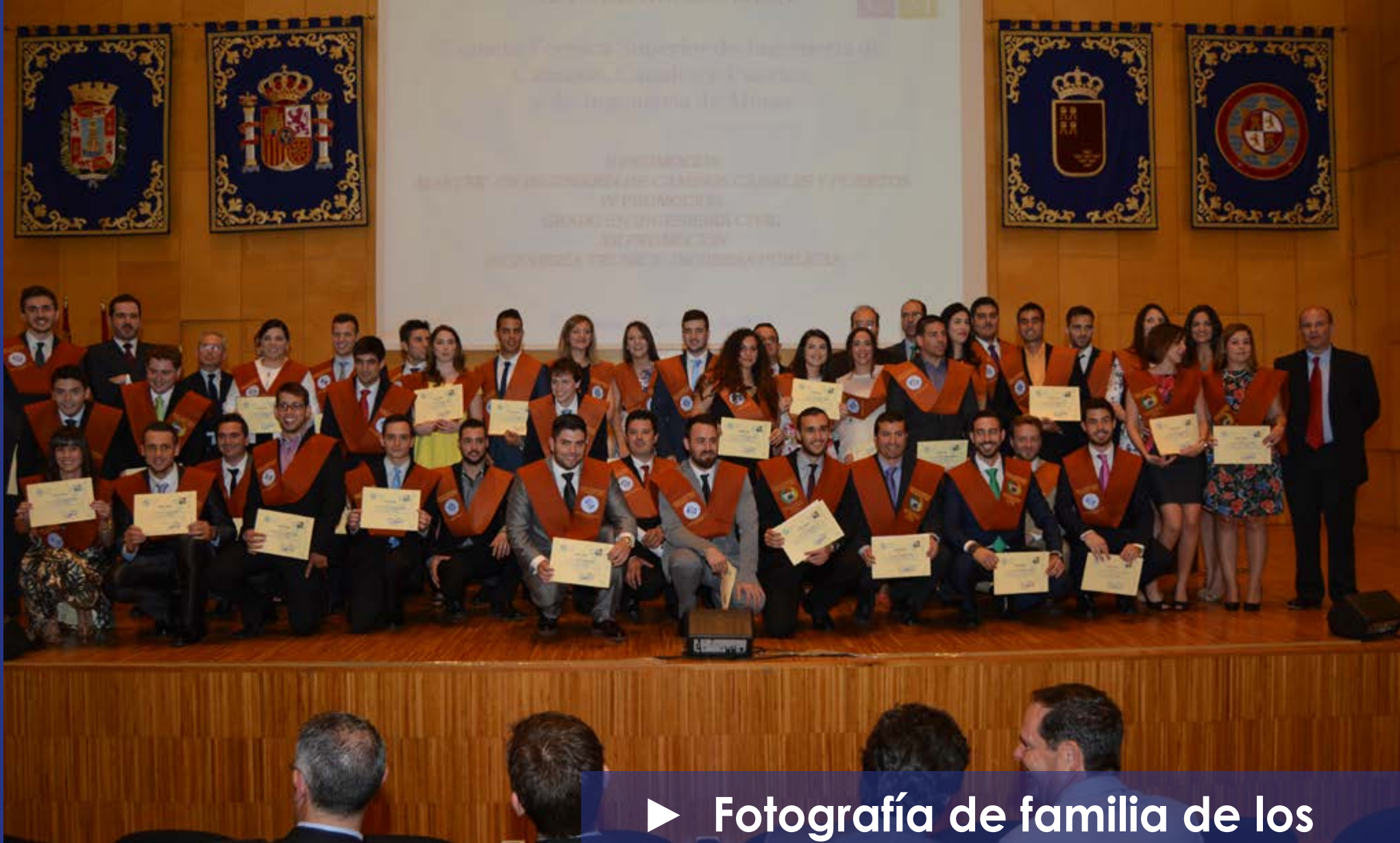
► Fotografía de familia de los graduados de la EICM en 2015