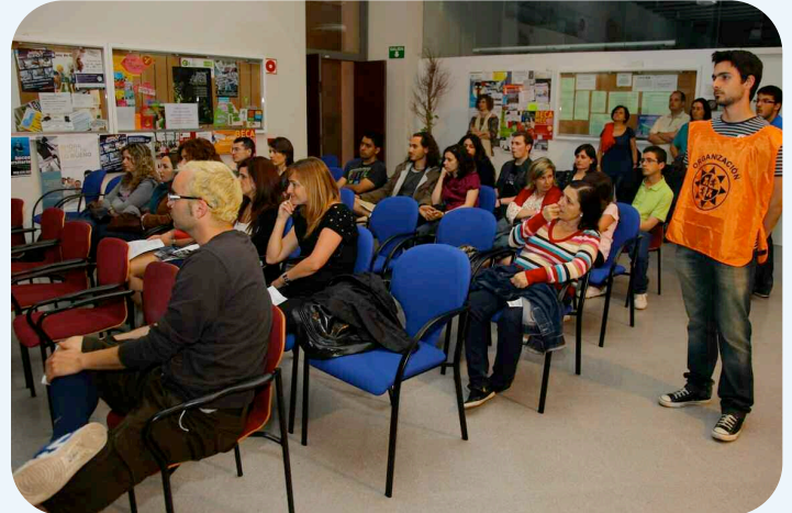
El hall del Hospital de Marina fue el lugar escogido para el recital de poesía