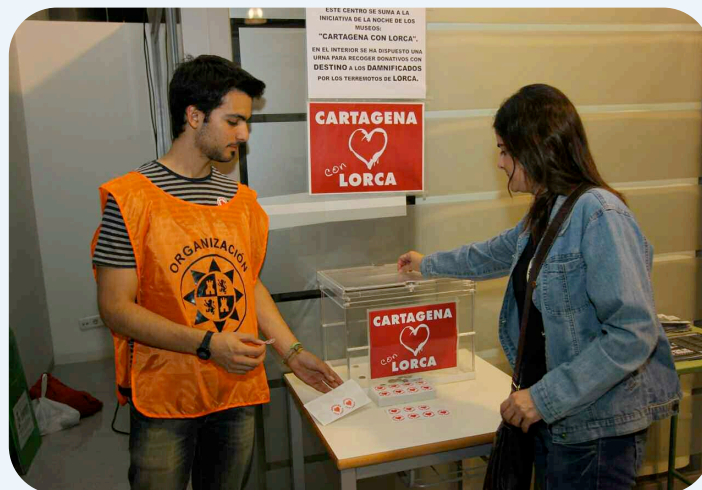
Una de las mesas instaladas en la UPCT para ayudar a Lorca

El Consejo de Estudiantes y las Delegaciones de los Centros de la Universidad Politécnica de Cartagena, en coordinación con el Vicerrector de Estudiantes y Extensión Universitaria, enviaron más de 800 litros de leche y más de 650 litros de agua a Lorca, como ayuda a los damnificados. El envío de estos alimentos se realizó a través de Protección Civil Cartagena.