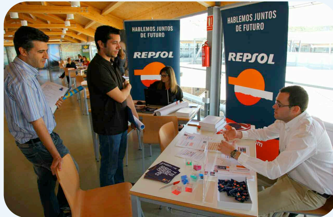
Repsol fue una de las empresas que ofreció información a los estudiantes

Este encuentro ofrecía a los estudiantes la posibilidad de contactar directamente con los responsables de las empresas y tener la posibilidad de conseguir una entrevista de trabajo, dejar el currículum vitae en la empresa que más se adapte al perfil laboral del universitario y asistir a las conferencias y mesas redondas en las que se ofrece información sobre cómo realizar una búsqueda activa de