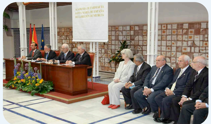
La inauguración se desarrolló en el Patio de las Comarcas de la Asamblea