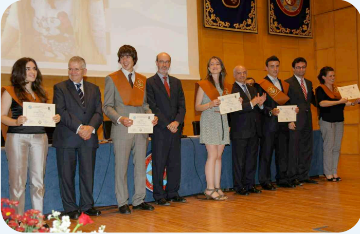
Los estudiantes reciben sus diplomas