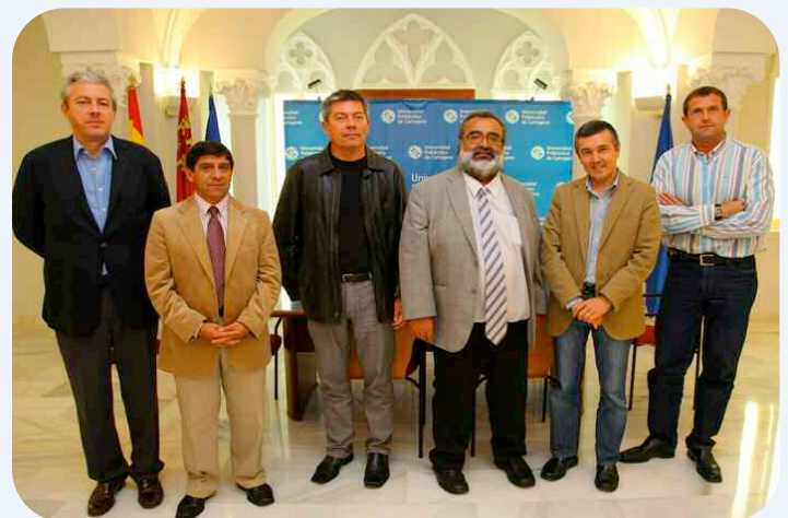
Los investigadores chilenos, con responsables académicos de la UPCT

ron muy interesados por el Campus de Excelencia Mare Nostrum y por explorar líneas de