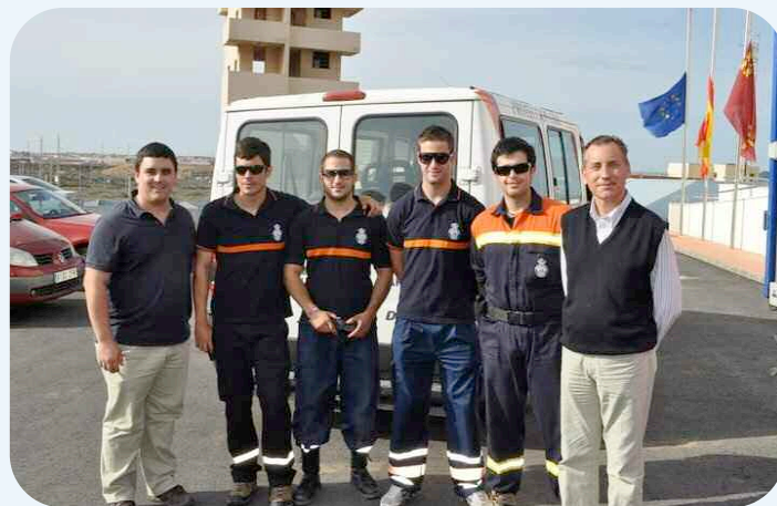
Los estudiantes enviaron alimentos en coordinación con el Vicerrectorado

boración en la Campaña "Cartagena con Lorca", así como a diferentes instituciones y ONGs que han colaborado en las tareas técnicas de evaluación de los