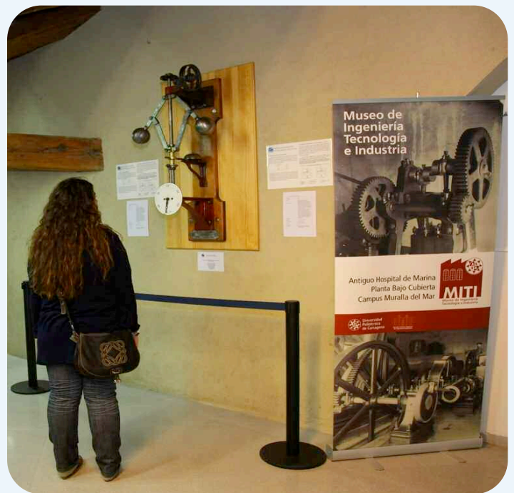
El Museo de Ingeniería, Tecnología e Industria estuvo abierto toda la noche