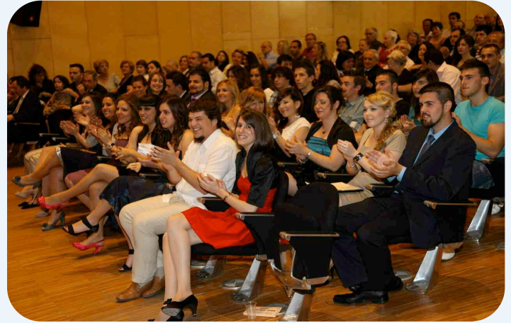
Alumnos, familiares y amigos llenaron el Paraninfo