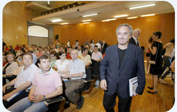
Ferrán Adrià fue nombrado Académico Ilustrado de la Academia de Farmacia