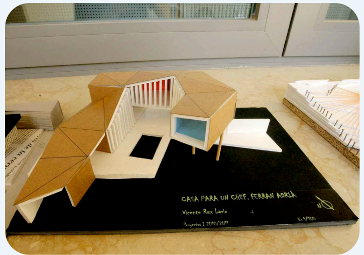
La maqueta diseñada por estudiantes de Arquitectura