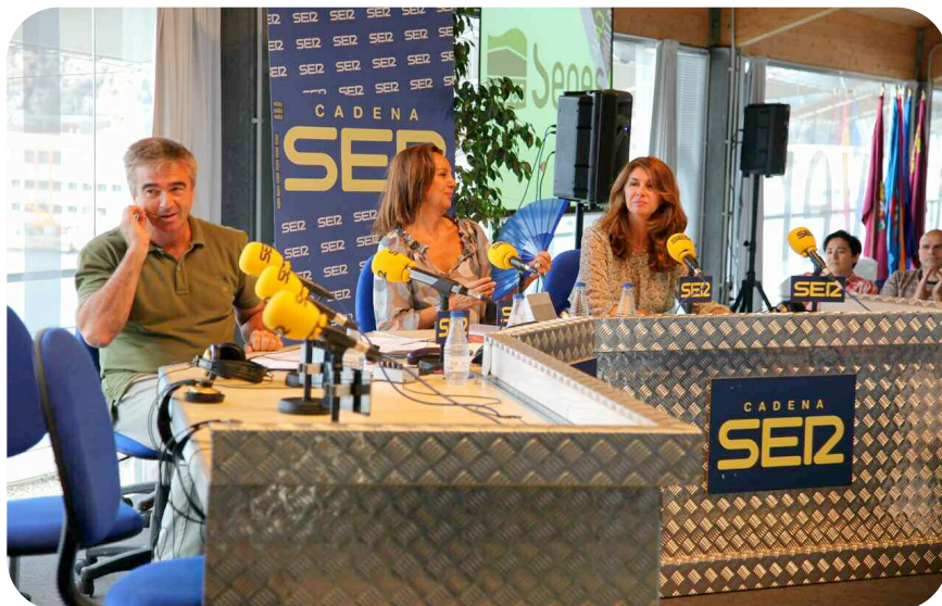
El periodista Carlos Francino dirigió el programa Hoy por Hoy desde la UPCT