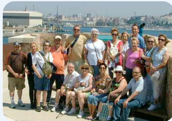
El Curso concluyó con una actividad de senderismo al Fuerte de Navidad

cas los alumnos han tenido la oportunidad de conocer actividades como el aquafitness en la piscina, pilates, taichí, relajación, bailes de salón, risoterapia y musculación adaptada.