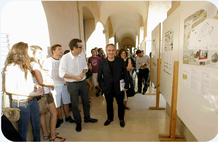
El cocinero catalán, junto a los estudiantes