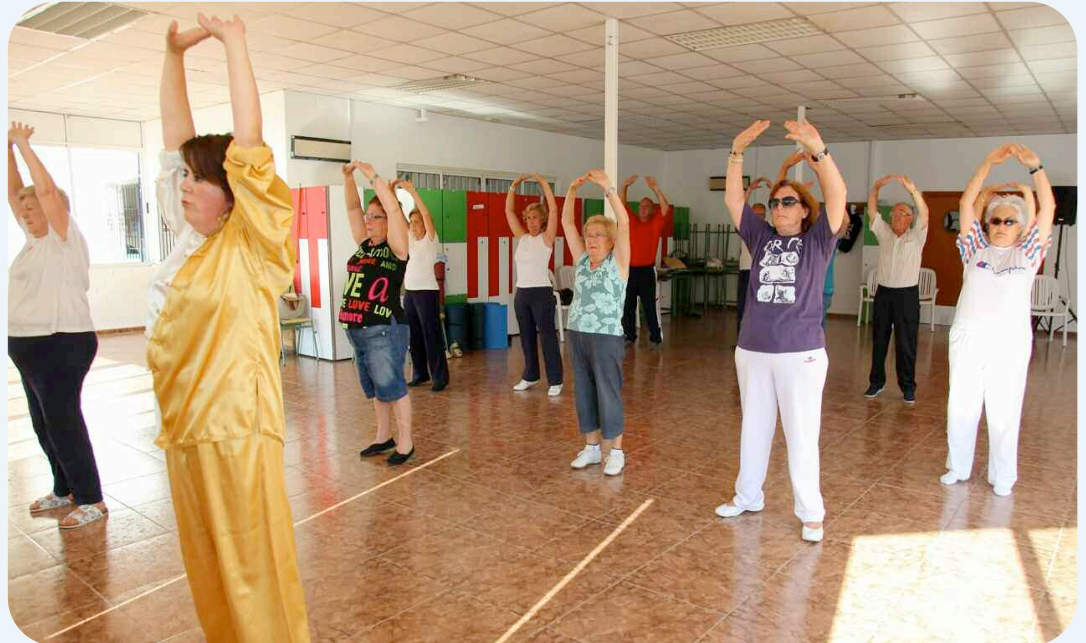
Los alumnos del Curso de Verano “Actividad Física y Salud en la edad adulta”, durante una de las actividades