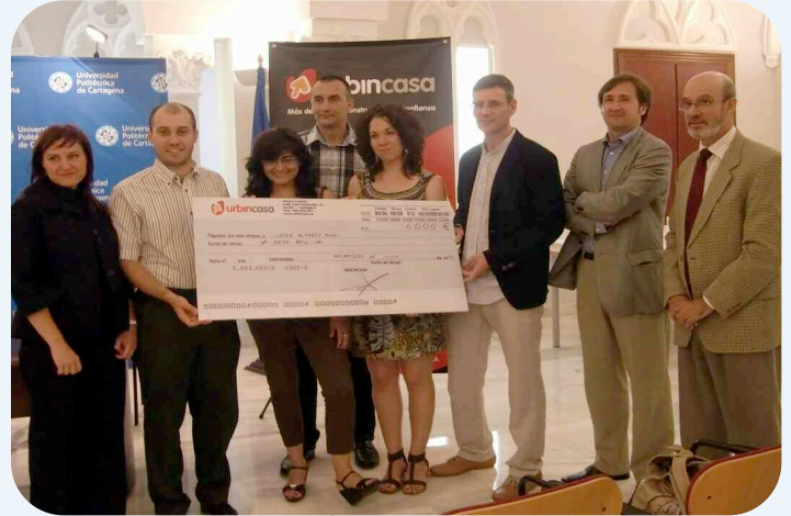
Los premiados recogieron el cheque en el Rectorado