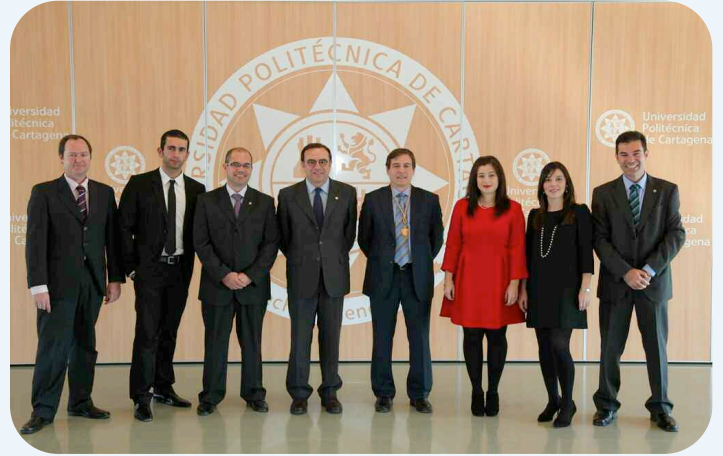
El equipo decanal con el rector de la UPCT