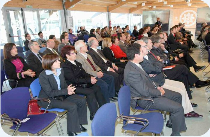
La toma de posesión se desarrolló en el salón de actos del CIM