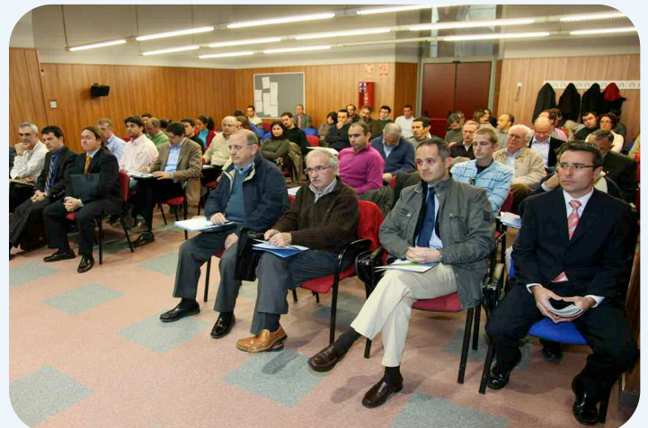
La jornada se desarrolló en la Escuela de Industriales