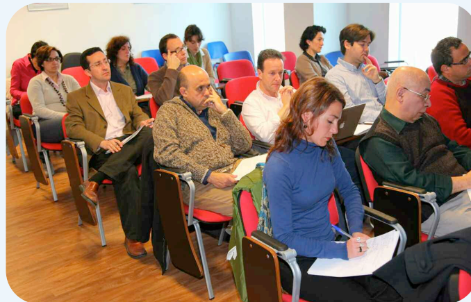
Algunos de los asistentes a la jornada en la que se presentó la Red ERRIN

rentes regiones. De esta forma, se pueden crear consorcios que ten-