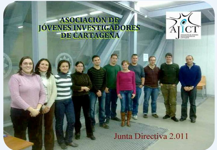
Imagen de la Junta Directiva de AJICT

tiene, entre otros objetivos, el fomento del desarrollo de la investigación científica profesional y la promoción de la cultura científica y tecnológica en Cartagena, la Región de Murcia y España, la organización de actividades de interés para los asociados: charlas, exposiciones, cursos de idiomas, seminarios, jornadas de formación y estimular las relaciones con aquellos sectores relacionados con la investigación dentro de la propia Universidad, el ámbito público y la empresa privada.