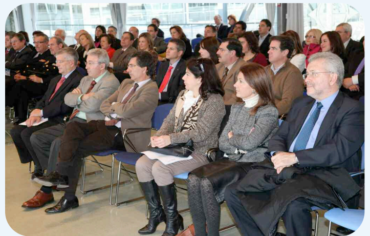
Miembros del equipo rectoral y directores de Escuela estuvieron presentes en el acto