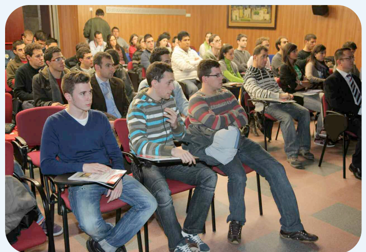
Asistentes a la Jornada sobre Automática y eficiencia energética

La jornada concluyó con una mesa redonda en la que participó el director de la Agencia de Gestión de Energía de la Región