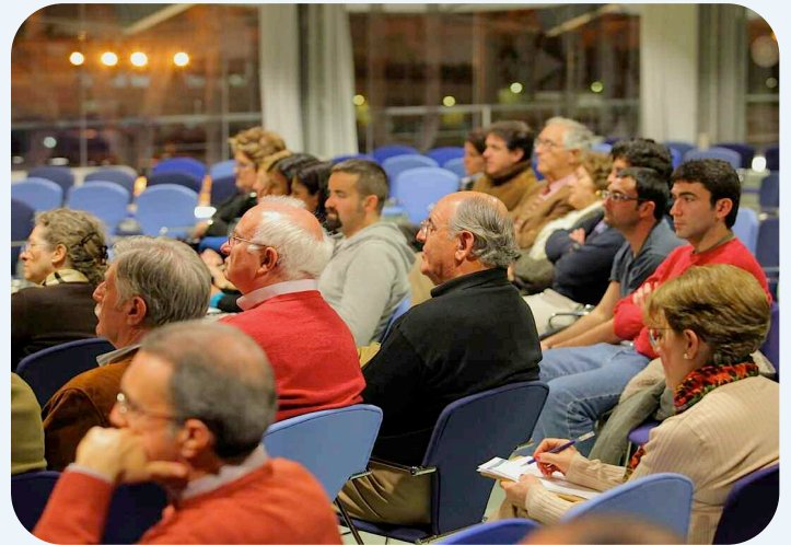
Las conferencias se desarrollan en el Salón de Actos del CIM

dos y corresponsales extranjeros en España. El acceso a las confe-