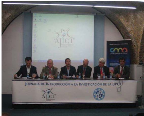
Figura 3: Mesa redonda de la IV Jornada de Introducción a la Investigación