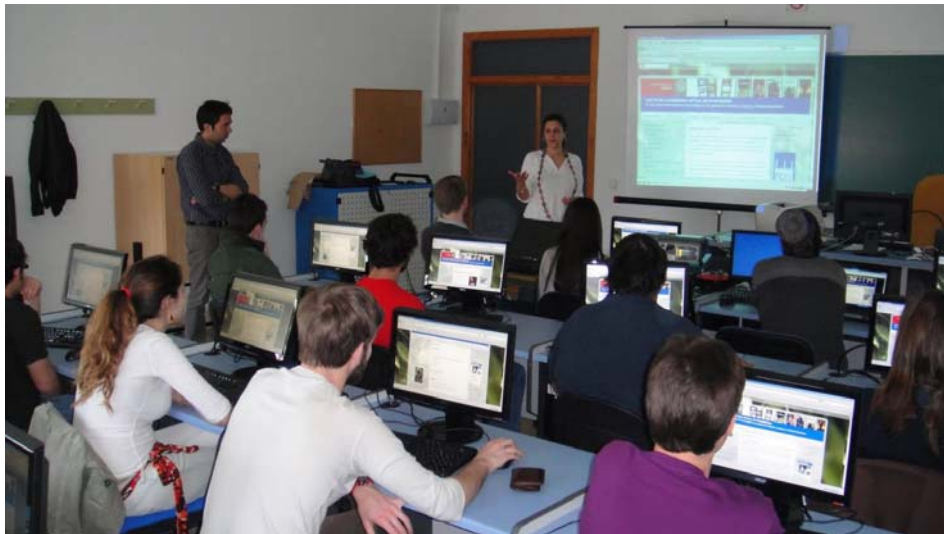
Figura 4.- Taller presencial celebrado con el alumnado como punto de inicio de la puesta en práctica del proyecto y de la herramienta virtual.

ordenador de su puesto en el aula. Dado que la experiencia de aprendizaje colaborativo diseñada integraba su participación a través de Facebook, aquellos que no tenían cuenta abierta en esta red social (aproximadamente el 40% del alumnado), se crearon una. Además, en esta sesión se suscribieron al canal de cine enTICine Tube . Dicha sesión sirvió también para vincular al grupo, que, de este modo, inició el contacto que los integraba en una actividad colaborativa (que comenzaba por la organización para el visionado de las películas) y que después habría de reforzarse en la interacción en el Fórum.