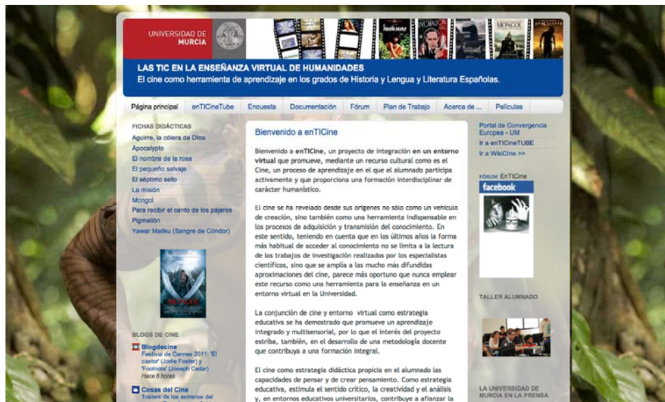
Figura 1.- Vista general de la web enTICine .

El sitio web enTICine se desarrolló con distintas herramientas gratuitas que, una vez combinadas, permiten la configuración de un entorno virtual altamente sugestivo y muy práctico.