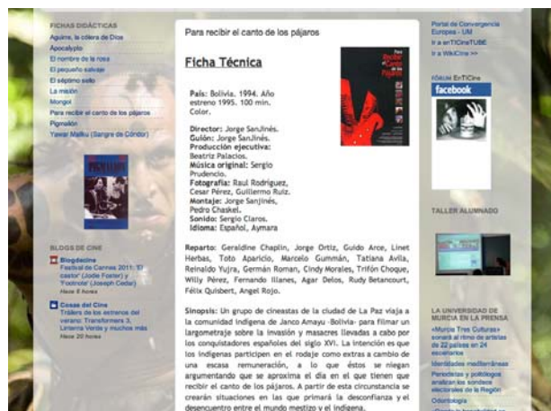
Figura 3.- Aspecto de parte de la ficha técnica de una de las películas seleccionadas, tal y como se visualiza en red.

Se completó esa ficha para cada una de las películas seleccionadas y también se dotó de contenidos a los distintos apartados en los que se había estructurado la página web enTICine , como “Plan de trabajo” o “EnTICine Tube”.