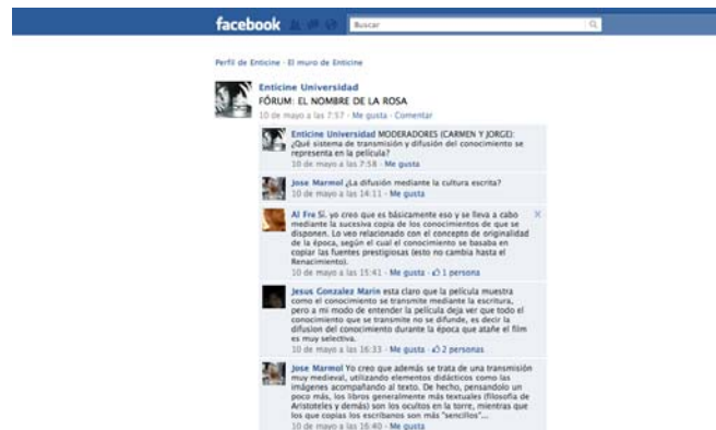
Figura 5.- Vista del fórum de una de las películas seleccionadas.

Para la tarea de documentación que han de llevar a cabo, los alumnos cuentan con las referencias que los profesores incluimos en la ficha didáctica, pero también con resultados de su propia búsqueda. En efecto, los alumnos han aprovechado el espacio de Facebook destinado al Fórum para enlazar documentos relacionados con el debate (vídeos, artículos) y compartirlos con el grupo. Esto es una prueba del aprendizaje colaborativo que se está llevando a cabo con la web y, al mismo tiempo, pone de relieve que se ha despertado en el alumno un interés por el tema que le lleva a ir más allá de lo que se le presenta. Desde nuestro punto de vista, se invierte la habitual resistencia del alumno al material complementario que se propone en clase para ampliar conocimientos y merece una reflexión sobre el fomento de la creatividad en el aula.