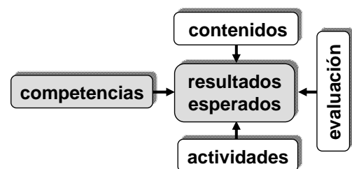
Figura 2. Planificación del proceso de enseñanza-aprendizaje