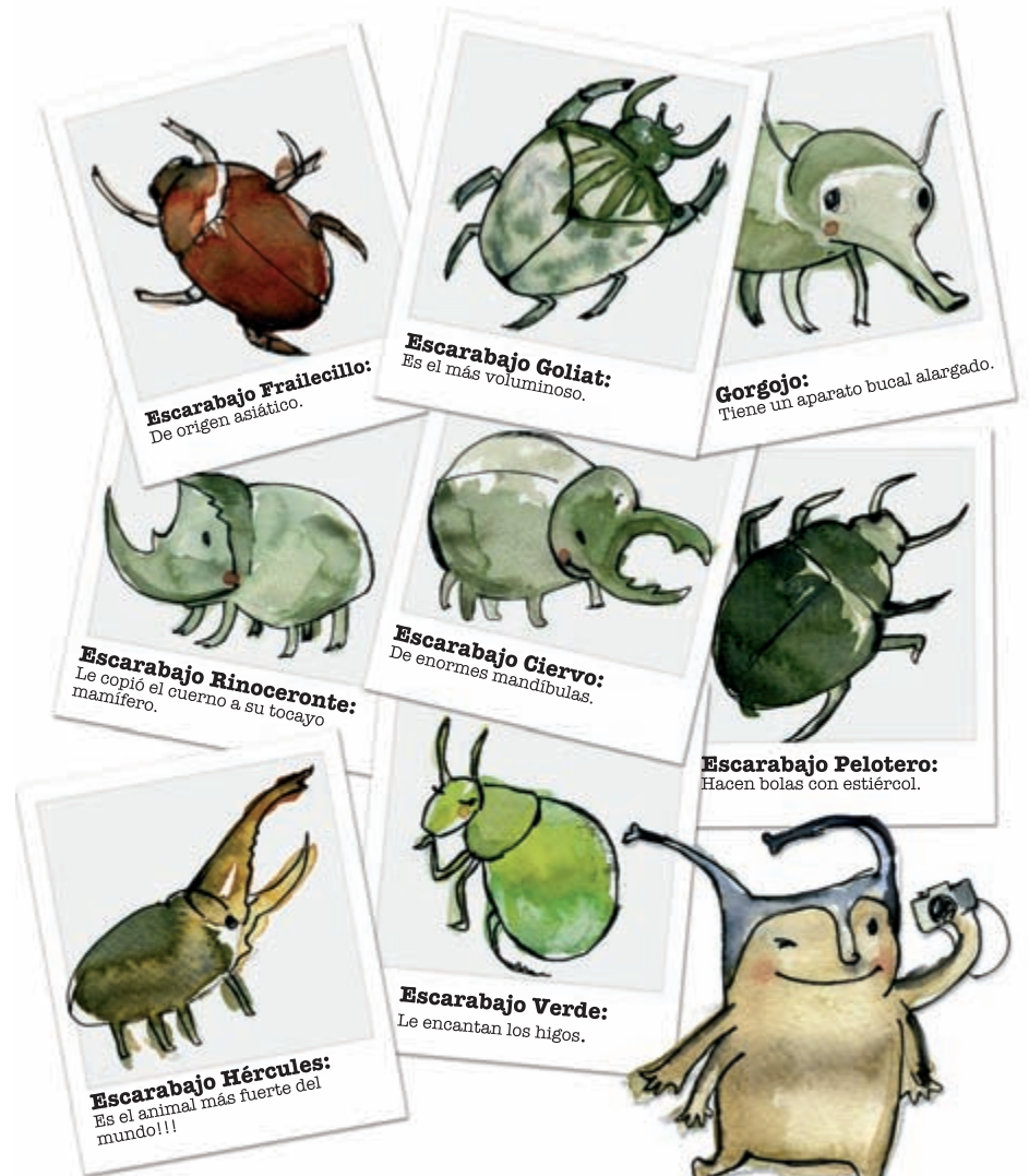
Escarabajo Frailecillo: De origen asiático.