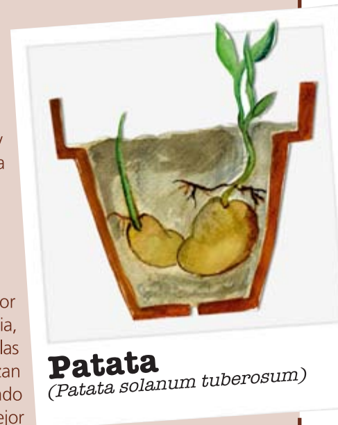
Patata ( Patata solanum tuberosum )

Si las hojas de tu planta tienen moho, podrían tener una infección de bacterias u hongos. Si te parece que tu planta está infectada, tírala a la basura o entiérrala.