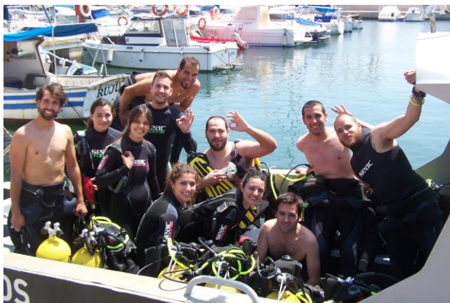
Experiencia docente: VIMAR LA VILA. Alumnos.

Una manera de materializar este desafío es aplicando en ambientes abiertos, infomales, creativos y emotivos la regla de Convencer a través de la acción y no de la discusión ; que se presenta como una de las estrategias más eficientes de adaptación y cambio. En este sentido la propuesta de una asignatura indicadora diseñada para los alumnos de último año de carrera y por un innovador e multidisciplinar equipo de docente orientada a integrar y desarrollar las competencias estratégicas, genéricas y específicas diseñadas a través de su periplo por la universidad, permitirá a los alumnos un alto grado de seguridad, a los docentes aplicar sus conocimientos, competencias y habilidades y, finalmente, a la Universidad un indicador real de su grado de excelencia alcanzado.