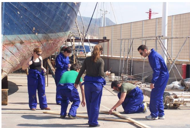
Experiencia docente: VIMAR LA VILA. Alumnos.

Las competencias que el alumno ha de adquirir, deben ser la expresión de su habilidad para desarrollar eficazmente determinadas funciones. Ello implica la asunción por parte del estudiante de un papel activo y participativo en el proceso de su propia formación permanente - construcción del conocimiento-, con el fin de llegar a la toma de conciencia de que su tránsito en la universidad es sólo una etapa de un proceso de aprendizaje que se extenderá a lo largo de toda la vida.