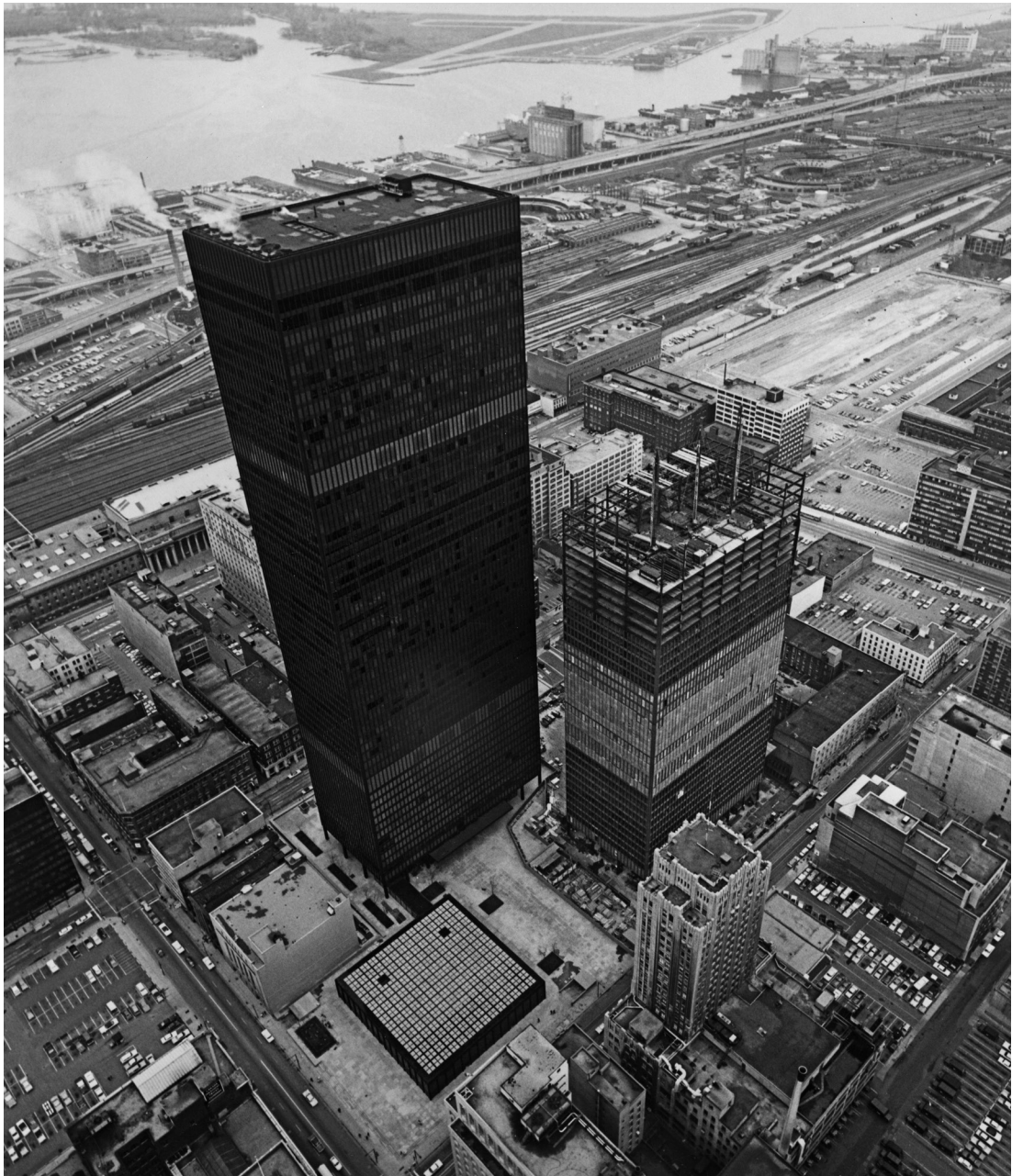
Figura 3. Vista aérea del Toronto-Dominion Centre.