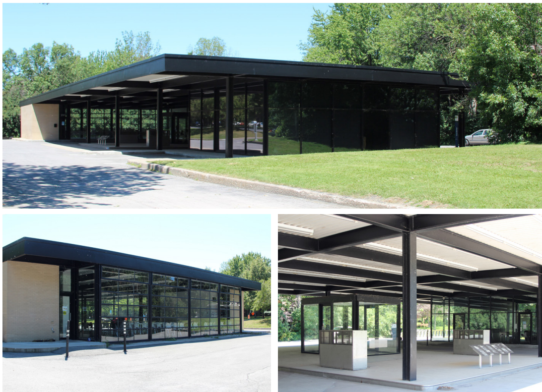
Figura 12. Vista general (a), fachada del volumen del taller mecánico (b) detalle de la zona central (c) de la estación de servicio Esso en la Île-des-Soeurs tras su transformación en centro social, 2017.