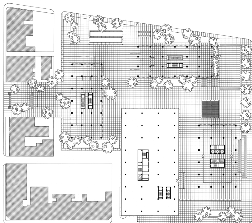
Figura 5. Planta del nivel de los vestíbulos del Westmount Square de Montreal.