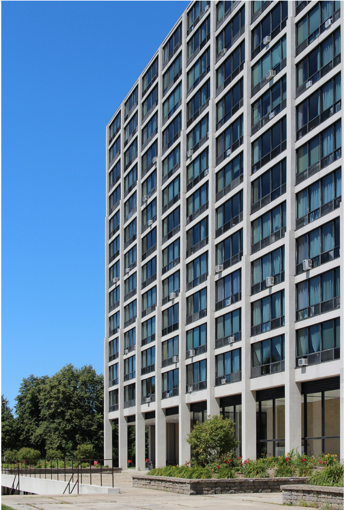
Figura 9. Detalles de la fachada del High-Rise Apartment Building n.1 en L'île des Soeurs, 2017.