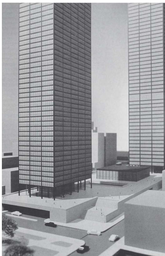
Figure 7. Model for the Dominion Centre project in Montreal (1968-1969).

derribo de los edificios comerciales existentes o la construcción de la torre más alta de la ciudad hasta ese momento, sino la controvertida conversión de un tramo de una de las arterias comerciales más importantes de Montreal, la calle St. Catherine, en túnel. 42 Sin dudas, una solución urbanística muy arriesgada que habría evitado el principal problema que presenta el Federal Centre de Chicago pero, a su vez, habría cambiado de manera considerable la fisonomía del centro de la ciudad. Asimismo, puede considerarse como un compendio o epílogo de todas las experimentaciones anteriores, así como una variación más de las múltiples combinaciones posibles del