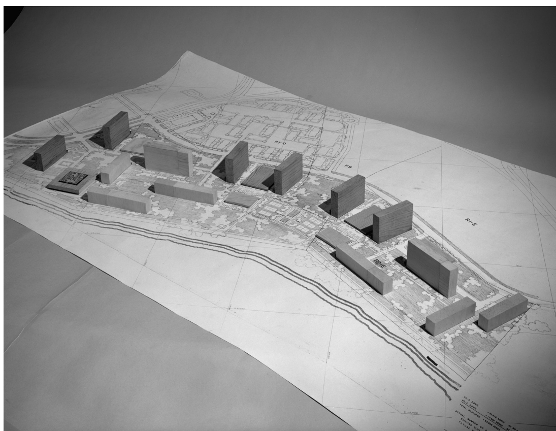
Figura 8. Maqueta para la fase II de la planificación urbanística de l'Île des Soeurs, Mies van der Rohe, 1969.