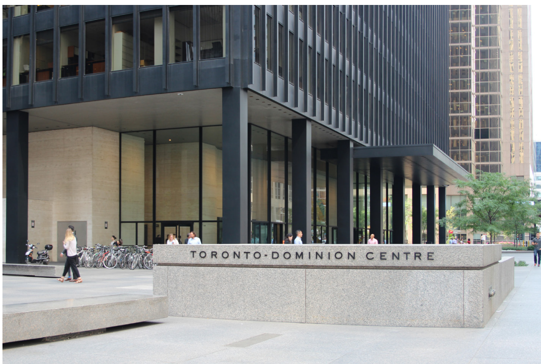
Figura 4. Detalle a nivel urbano del Toronto-Dominion Centre, 2017.