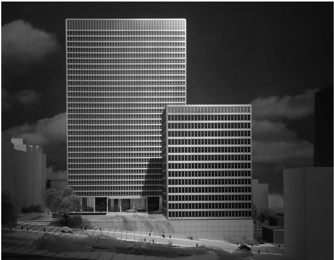
Figura 2. Imagen de la maqueta del proyecto Mountain Square de Montreal.