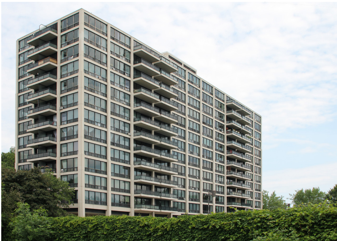
Figura 10. High-Rise Apartment Building n. 2 en L'Île des Soeurs, 2017. Título de la fotografía: Façade sud du 100 De Gaspé sur l'île-des-Soeurs dans l'arrondissement Verdun à Montréal, Québec, Canada.