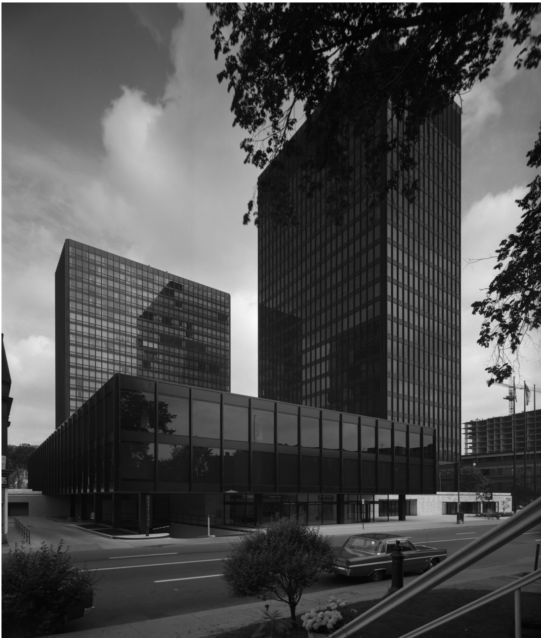
Figura 6. Vista del Westmount Square de Montreal, 1969.