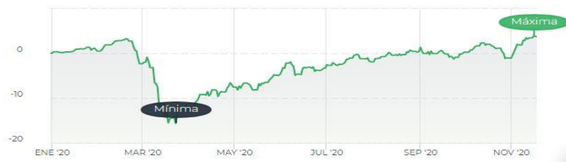
Gráfica 3. Representación de la rentabilidad frente al tiempo del fondo solidario y sostenible.

El tipo de inversor al que van destinados es a aquellos que buscan rentabilidad pero que, a su vez, generen un impacto positivo en la sociedad y el entorno. No se dirigen a inversores completamente conservadores, ya que el nivel de riesgo es medio, debido a que la inversión está expuesta a un 50% en renta variable. En la siguiente gráfica se observa la evolución de la rentabilidad de este fondo en 2020: