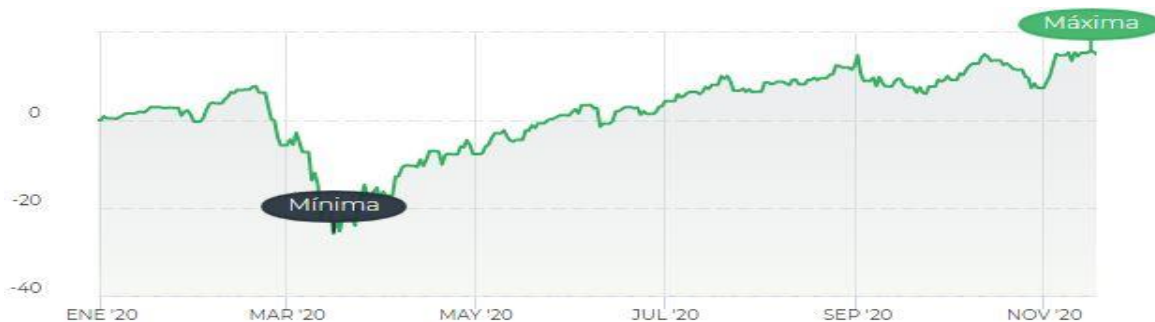
Gráfica 4. Representación de la rentabilidad frente al tiempo del fondo Megatrends.

Este fondo consiste en invertir en tendencias actuales como calidad de vida, crecimiento digital y medio ambiente, siguiendo siempre criterios ASG. Este fondo se dirige a inversores dispuestos a asumir un alto nivel de riesgo ya que este fondo se destina por completo a renta variable. En la siguiente gráfica se representa la evolución del valor liquidativo de este fondo en 2020: