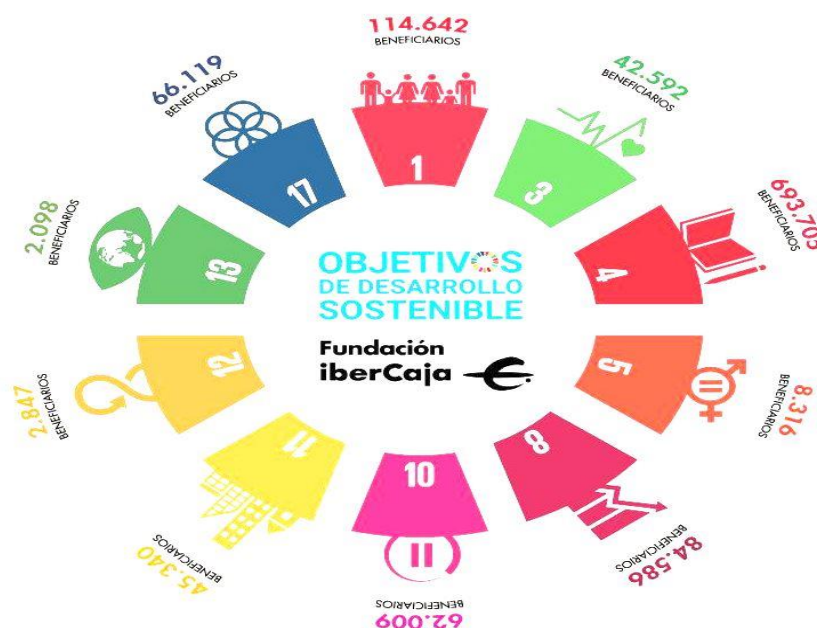
Ilustración 1. Impacto que Fundación Ibercaja presentó sobre los ODS en 2019.

El compromiso que Ibercaja Banco ha asumido sobre los ODS tiene un objetivo principal: la creación de oportunidades a nivel social y minimizar su impacto sobre el medio ambiente. En la siguiente ilustración, se puede ver el impacto que esta entidad ha producido sobre los ODS que ha establecido como prioritarios y el alcance conseguido: