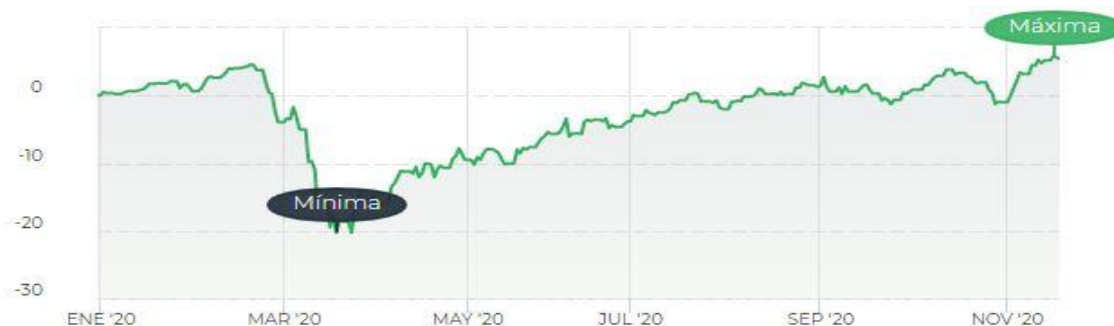
Gráfica 2. Representación de la rentabilidad frente al tiempo del plan de pensiones RVM.

Este plan combina estrategias de ISR y estrategias solidarias, donando parte de las comisiones de gestión a iniciativas sociales y medio ambientales. El requerimiento fundamental a la hora de seleccionar emisores es que desarrollen actividades cumpliendo criterios ASG y rechaza empresas relacionadas con la manufactura y venta de armas. Presenta un nivel de riesgo medio-alto debido a que el 60% se destina a renta variable. En la siguiente gráfica se observa la evolución de la rentabilidad de este plan en 2020: