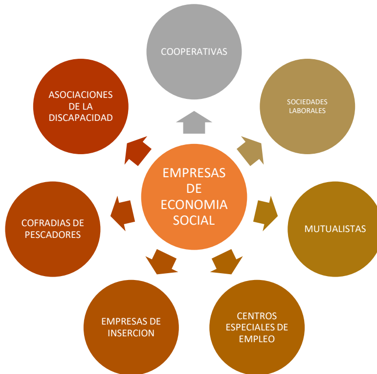
Figura 2 Tipos de Empresas de Economía social