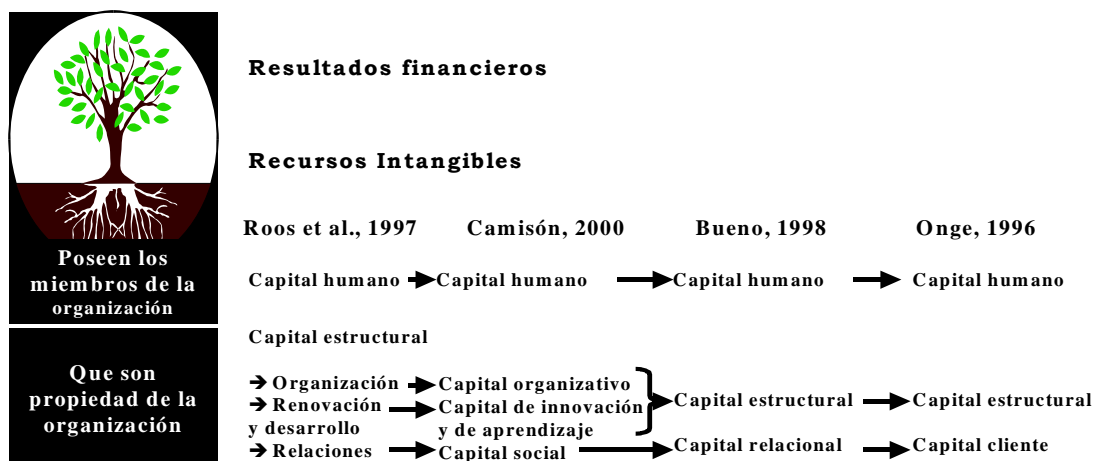
Gráfico 1. Componentes del Capital Intelectual

(Kaplan y Norton, 1992), quienes consideran, en una perspectiva mucho más cerrada, las relaciones de la organización con sus clientes en lo que denominan perspectiva de clientes, donde marcan unos objetivos a conseguir y las medidas para lograrlos. En esta misma línea, Edvinsson y Malone (1997) se refiere a la focalización en clientes dentro del “Navegador de Skandia”, como indicadores de la situación presente de la compañía. Bontis (1996) habla de capital de clientes y lo define como “el conocimiento de los canales de distribución y relaciones con clientes”. Otra autora interesada en las relaciones de la empresa con sus clientes, pero que amplía las miras más allá de los mismos es Brooking (1996). Esta consultora los denomina activos de mercado, siendo "los que se derivan de una relación beneficiosa de la empresa con su mercado y sus clientes". Comprenden las marcas de productos, el prestigio, la repetitividad del negocio, los canales de distribución, la imagen y el nombre de la empresa, y otros tipos de contratos que dan una ventaja competitiva a la empresa.