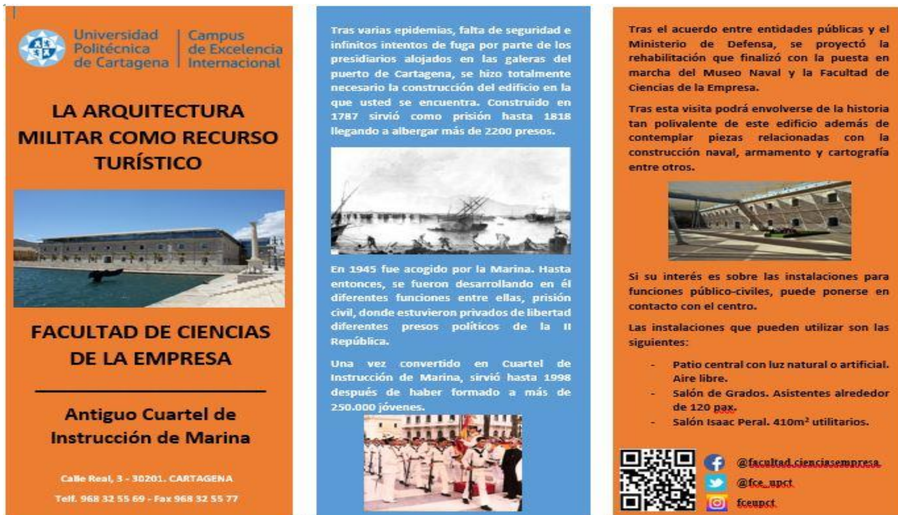
Imagen 9. Ejemplo de tríptico publicitario de la Facultad de Ciencias de la Empresa de la Universidad Politécnica de Cartagena. Elaboración propia.