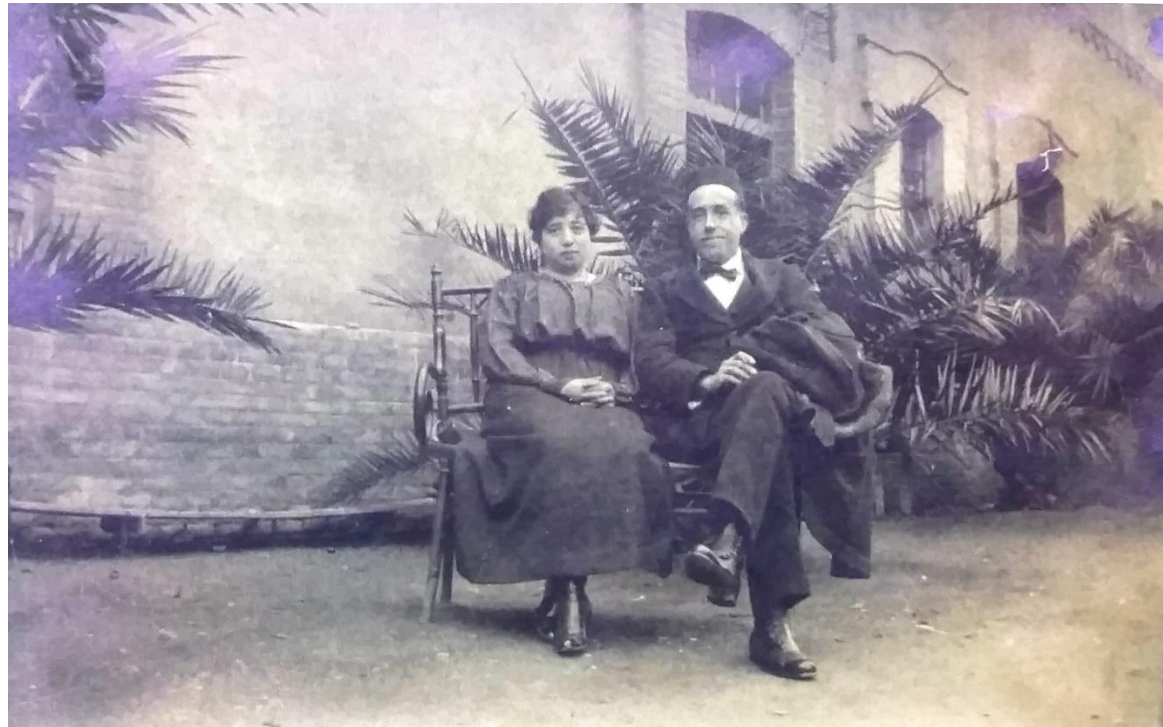
Imagen 6. Julián Besteiro y su mujer en el patio del Cuartel de Presidarios. Año 1917. Fuente: CHACÓN BULNES, J.M. El cuartel de presidiarios y esclavos de Cartagena. La Casa negra . Universidad Politécnica de Cartagena. 2012. Cartagena.