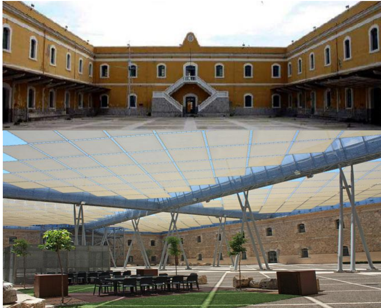
Imagen 7. Antes y después de la rehabilitación del patio del Cuartel de Instrucción de Marina, hoy la Facultad de Ciencias de la Empresa de la Universidad Politécnica de Cartagena.