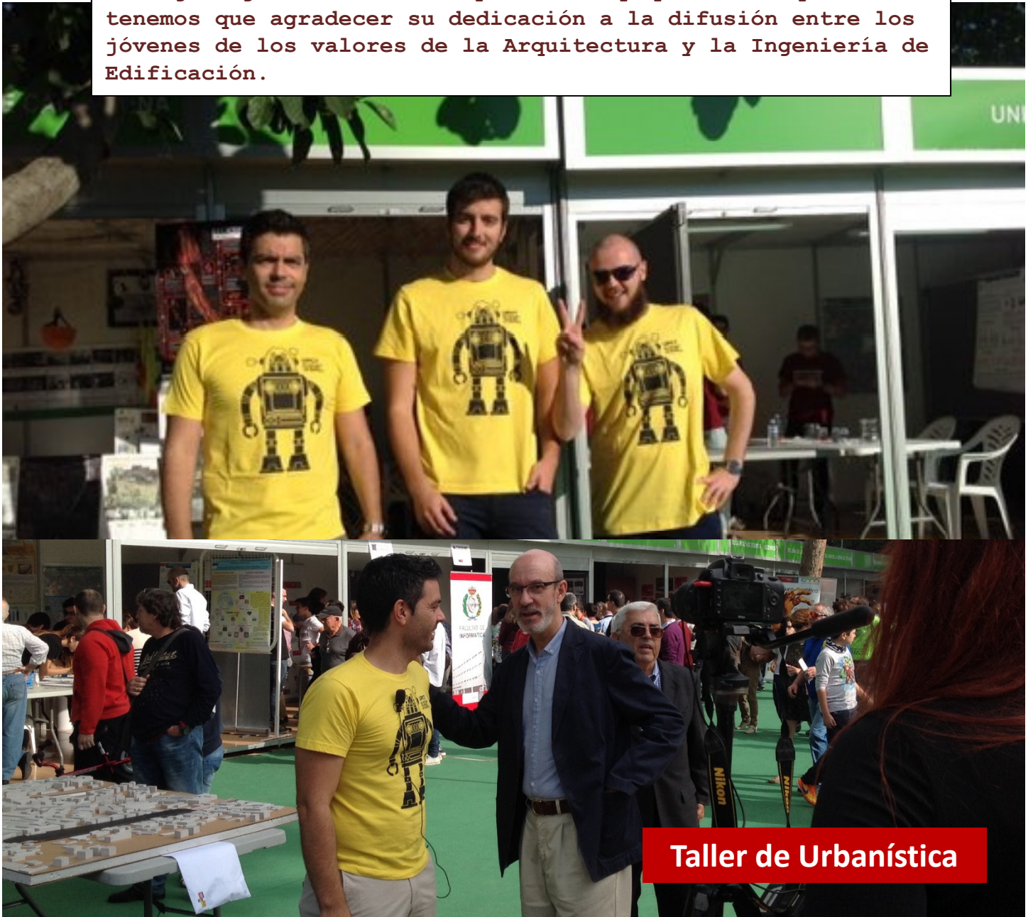
Taller de Urbanística