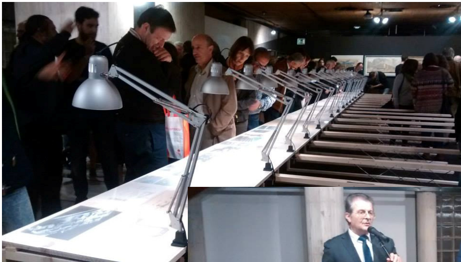
Los asistentes interesados contemplan los planos sobre el elegante y austero montaje de la exposición