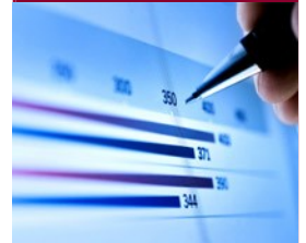
Variación relativa interanual (agosto) del número de afiliados

Comparando las tasas interanuales de variación de los meses de agosto, se aprecia que agosto de 2015 es el segundo mejor agosto de toda la serie analizada desde 2009, aunque el crecimiento de la afiliación en la comarca y en el municipio de Cartagena ha sido inferior al de agosto de 2014, y sensiblemente inferior al de la Región. Se encadenan ya catorce meses consecutivos con crecimientos interanuales de la afiliación, desde marzo de 2014, aunque el crecimiento de agosto de 2015 es el más bajo de todos ellos.