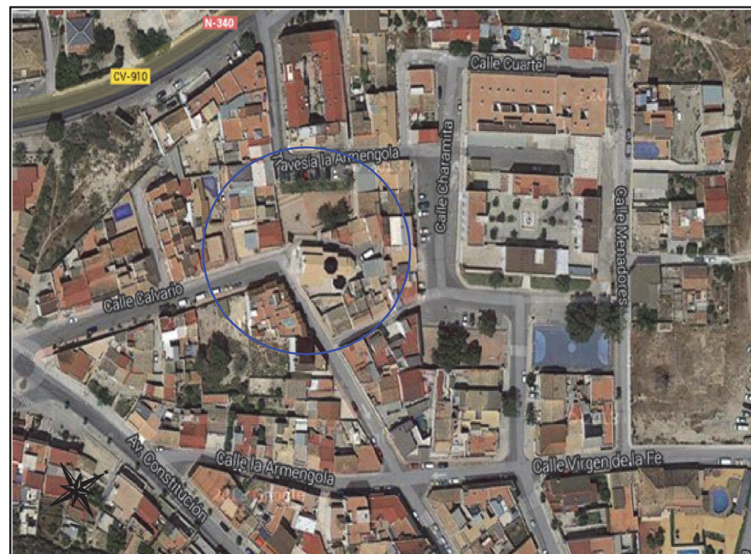
IMAGEN AÉREA NOROESTE