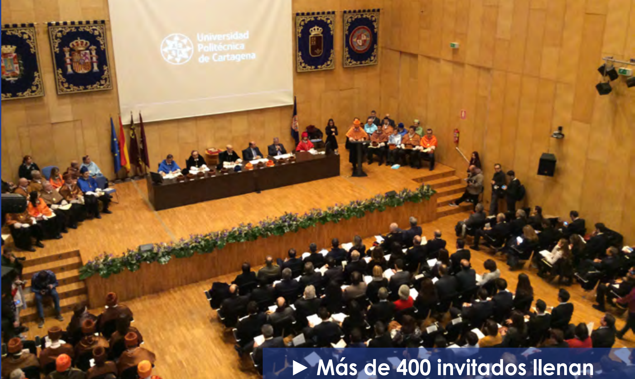
► Más de 400 invitados llenan el Paraninfo de la UPCT