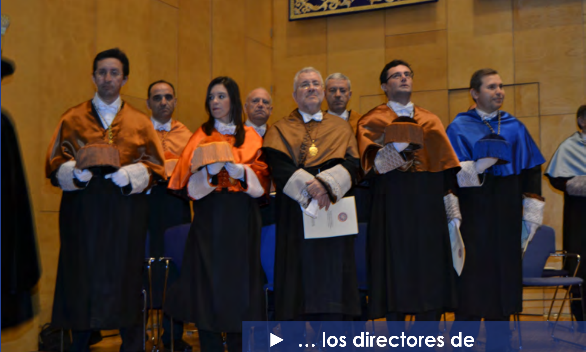
► ... los directores de los diferentes centros...