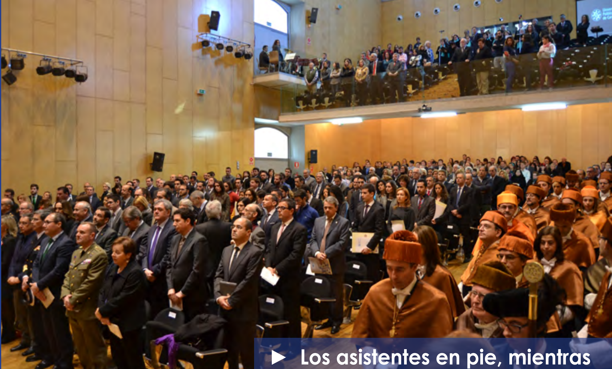
► Los asistentes en pie, mientras la Escuela Coral Saucés interpreta el 'Gaudeamus Igitur'