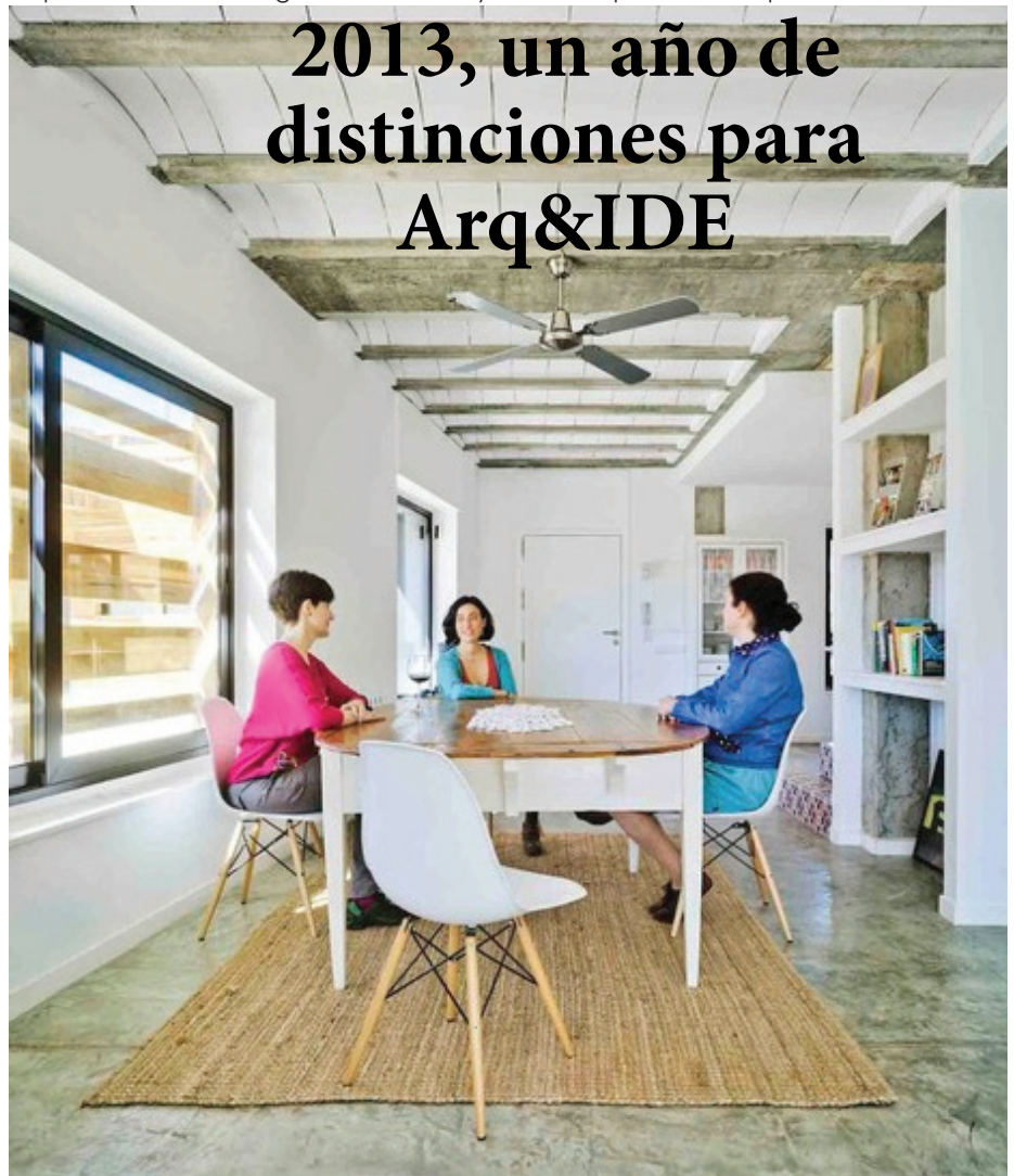
Imagen de la 'Casa para tres hermanas', por la que han sido galardonados profesores de la UPCT.