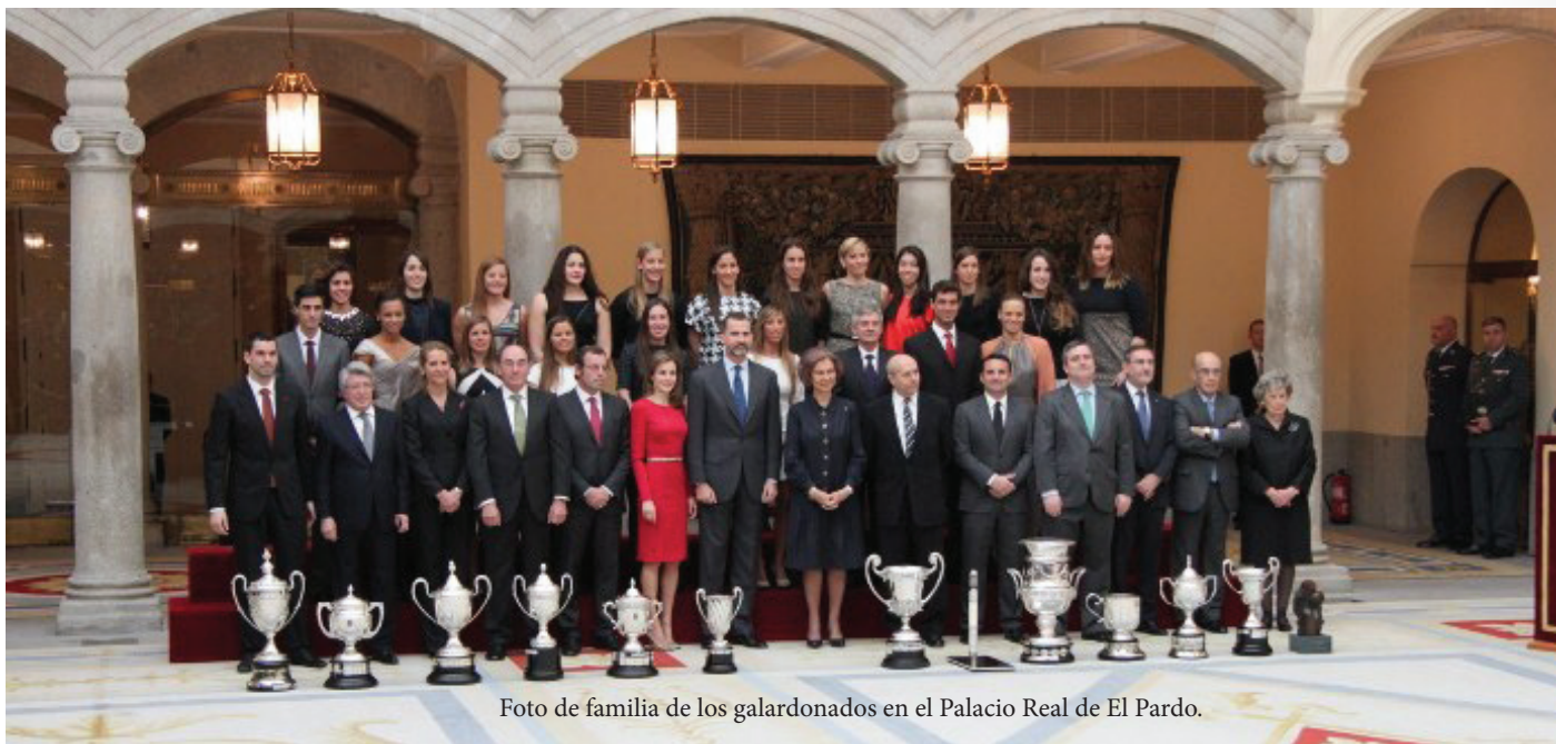
Foto de familia de los galardonados en el Palacio Real de El Pardo.