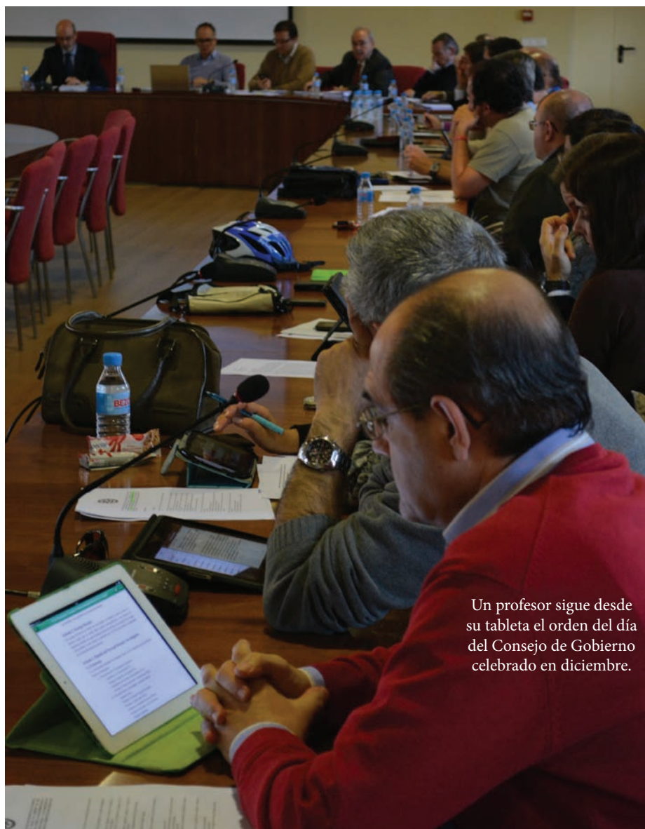
Un profesor sigue desde su tableta el orden del día del Consejo de Gobierno celebrado en diciembre.

Dichas medidas de reducción de gasto y de mejora de los ingresos deberán estar preparadas para el verano de 2014.