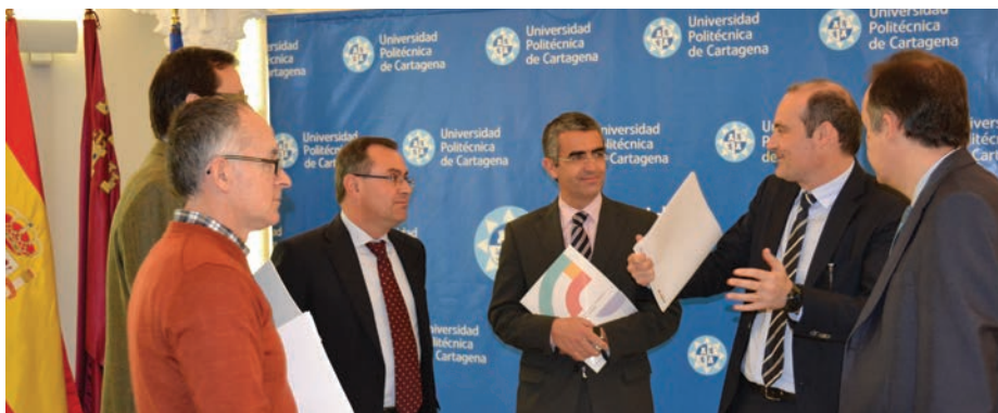
Reunión en la UPCT de los responsables de la Cátedra, la Politécnica y Cajamar.

na, presidió el acto de entrega de estos galardones, que concede el Consejo Superior de Deportes para reconocer a personas o entidades que, bien por su directa actividad o iniciativa personal, bien como participes en el desarrollo de la política deportiva, han contribuido en forma destacada a impulsar o difundir la actividad físico-deportiva.