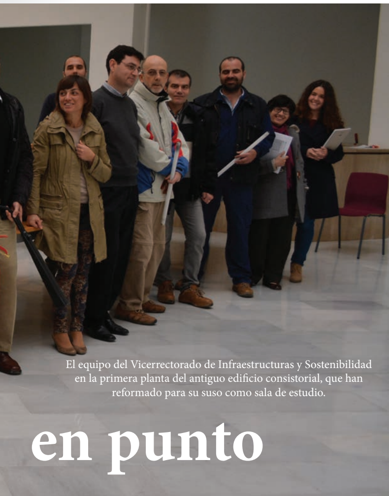
El equipo del Vicerrectorado de Infraestructuras y Sostenibilidad en la primera planta del antiguo edificio consistorial, que han reformado para su uso como sala de estudio.