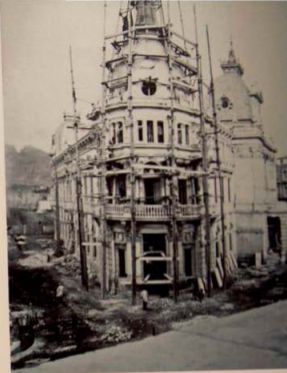
Obras del Palacio Consistorial donde participó Víctor Beltrí