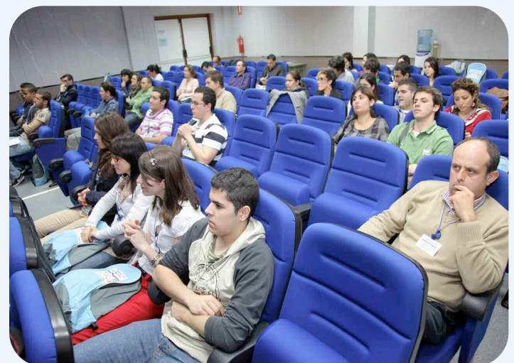
El curso tuvo lugar en el salón de actos de la Escuela de Ingeniería Agronómica