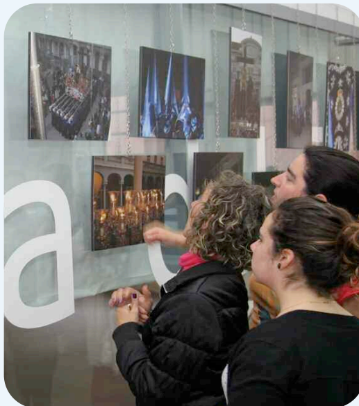
La exposición se pudo ver en la Casa del Estudiante