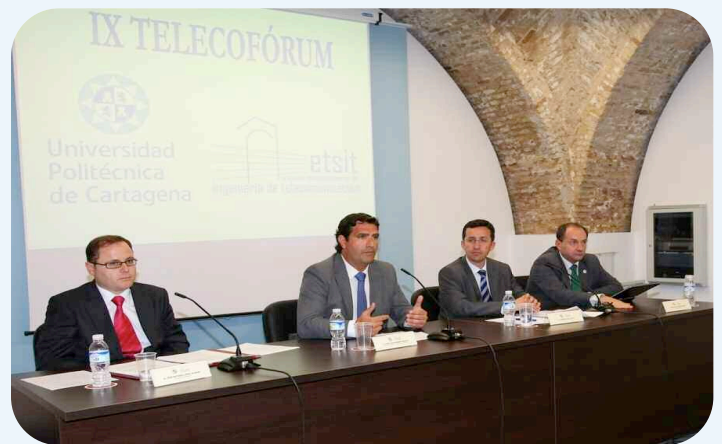
El futuro de las titulaciones de Telecomunicaciones se debatió en una mesa redonda

En las jornadas participaron empresas del sector, que presentaron novedosas aplicaciones y