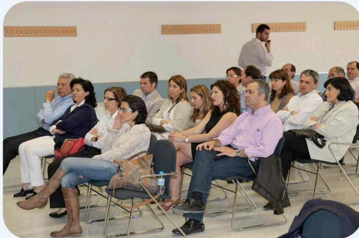
La sesión se celebró en el salón de grados de Ciencias de la Empresa

Mediterráneo. Los focos de excelencia que conforman esta estrategia