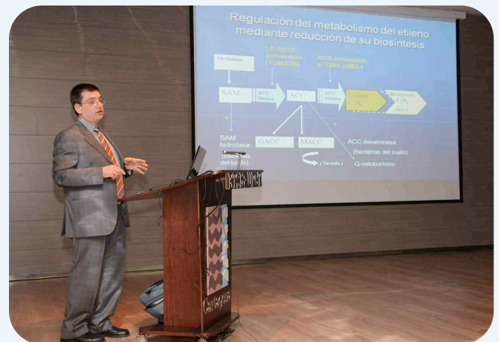
Más de treinta expertos explicaron las últimas novedades en estas tecnologías

El grupo de investigación de Postrecolección y Refrigeración de la UPCT y las empresas especializadas de la Región de Murcia en este sector se han convertido en un referente a nivel internacional no sólo por la calidad de sus productos, sino también por la utilización de tecnologías punteras en su elaboración y comercialización.