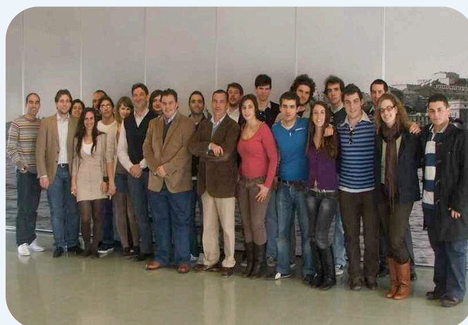
Asamblea estatal de estudiantes de Ciencias de la Empresa organizada en el CIM