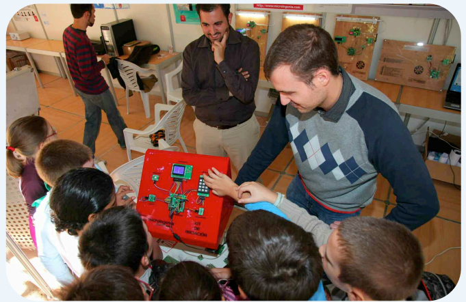
La electrónica también estuvo presente