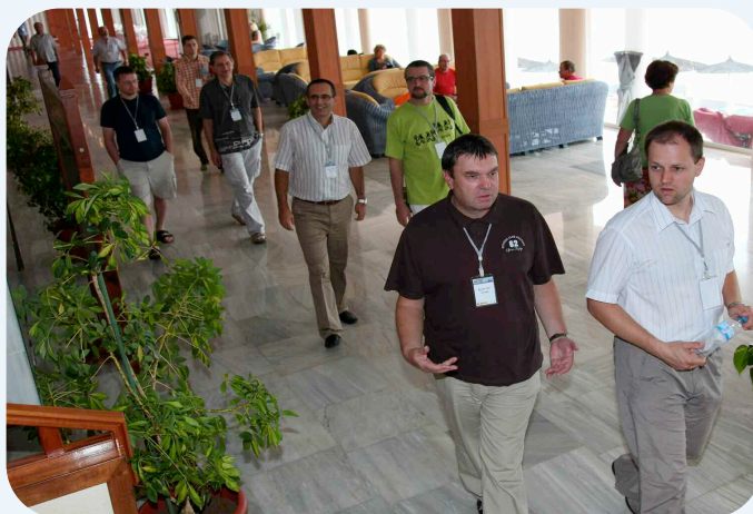
Asistentes al Congreso de Matemáticas celebrado en el hotel Galúa

No es el único establecimiento hotelero que se beneficia del movimiento de personas que atrae a Cartagena a profesores, investigadores, personal de otras Universidades, expertos en diversos campos y hasta familiares de estudiantes. Sólo a principios de curso, el hotel Galúa de La Manga acogió a casi 150 profesores e investigadores de varios países gracias a dos congresos internacionales que se realizaron en sus instalaciones durante varios días. El XIV Encuentro “Czech-Slovak-Spanish Workshop on Discrete