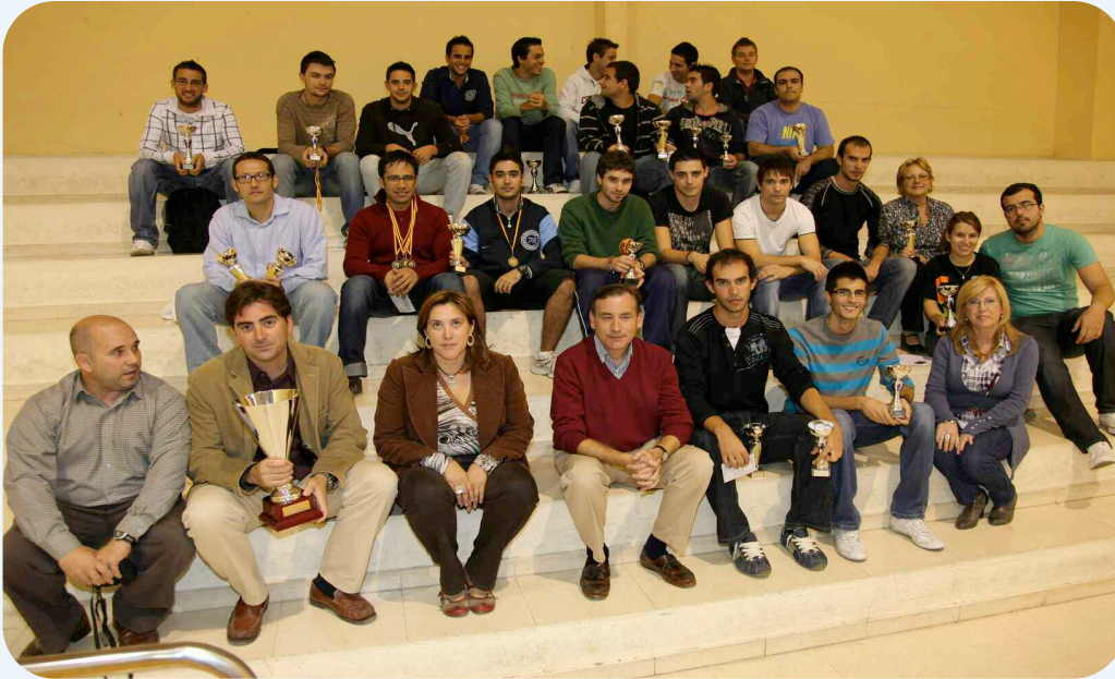
Los premiados premiaron tras la entrega de los trofeos en el Pabellón Urban