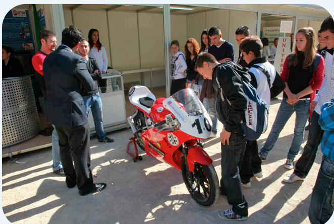
La moto que participó en la competición MotoStudent

Todas las fotos en la página UPCT Universidad Politécnica de Cartagena en Facebook