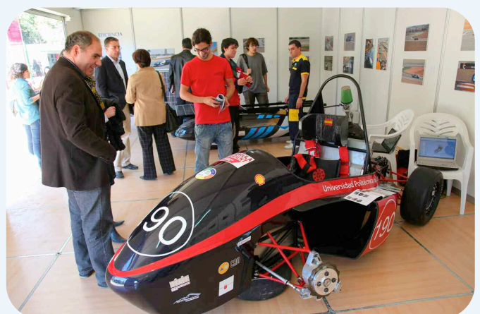
Los prototipos de la Formula Student y la Solar Race