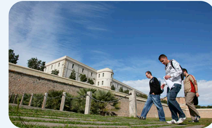
Varios estudiantes caminan hacia el campus de la Muralla

El mayor crecimiento de matrícula se ha registrado en la Escuela de Caminos y Minas, donde la