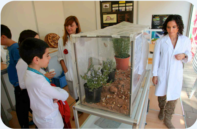
Un niño contempla un expositor repleto de caracoles