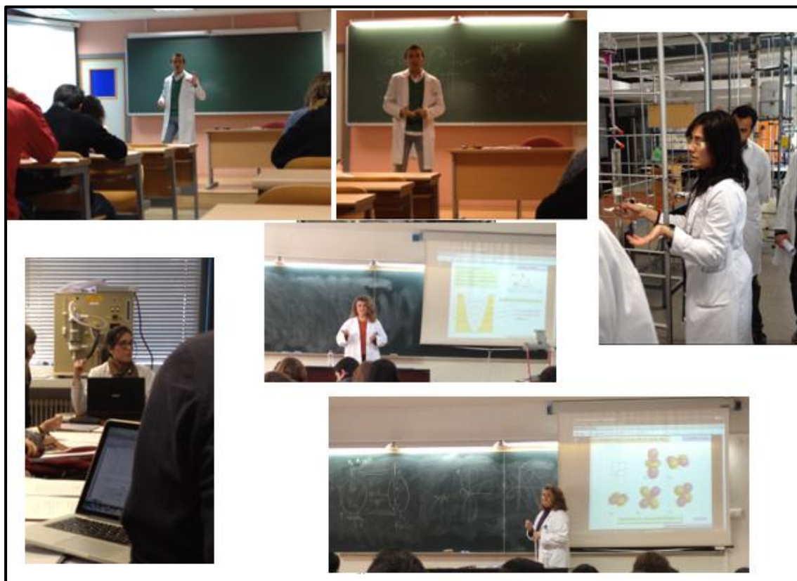
Figura 3.- Capturas de las grabaciones realizadas a los tres profesores

Igualmente, el profesorado novel señala que su capacidad para tomar iniciativas en su formación y desarrollo docente se ha visto incrementada gracias a su participación en el proyecto, dado que, una vez que son conscientes de los aspectos que han de mejorar, saben qué alternativas y actividades formativas han de buscar.