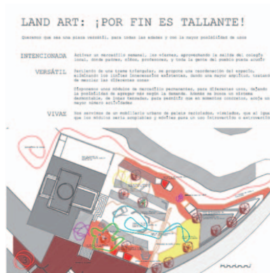
Figura 4. Imagen parcial del ejercicio de Intervención paisajística: LAND ART: ¡POR FIN ES TALLANTE! Reestructuración de la plaza mayor.

Estos ejercicios se realizan en grupos reducidos de 2-3 personas. Los resultados han ofrecido entre otros proyectos: mejoras en la calidad del espacio público (reestructuración de la plaza mayor, peatonalización de la carretera antigua, urbanización de solares vacíos para ofrecer nuevos servicios urbanos), recorridos e itinerarios con temáticas diversas (geología, patrimonio, paisaje, botánica, etc.), propuestas de acciones sistemáticas para la conservación patrimonial y puesta en valor de los molinos de viento, propuestas de nuevos usos en las ruinas de molinos, señalética y mobiliario para los itinerarios, land art funcional (miradores, hitos, producción agrícola, ...), catálogos de elementos patrimoniales edificados (casas, pero también aljibes, pozos, canalizaciones, eras, escuelas, corrales), etc.