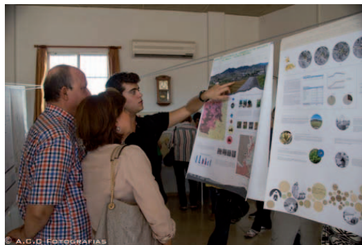
Figura 8. Imagen de la presentación de trabajos en la asociación de vecinos de Tallante, 2015 Un alumno explicando su propuesta a vecinos de Tallante

En el transcurso de la velada en la Asociación de Vecinos de Tallante, durante la cual los alumnos expusieron sus trabajos a los vecinos y contestaron a sus preguntas, se entregaron 2 premios consistentes en una suscripción por un año a la revista ON Diseño y 3 premios consistentes en lotes de libros de la editorial DPR Barcelona a aquellos alumnos con mejor continuidad y resultados del curso. Finalmente los vecinos de Tallante ofrecieron a todos los asistentes (vecinos, alumnos, profesores y autoridades locales) una fantástica merienda de despedida.