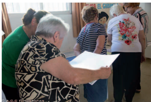
Figura 9. Imagen de la presentación de trabajos en la asociación de vecinos de Tallante, 2015 Vecinas comentando los diversos trabajos.