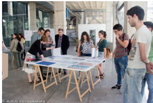
Figura 7. Imagen de la exposición en el CIM, UPCT, Cartagena, 2015

En el transcurso de la velada en la Asociación de Vecinos de Tallante, durante la cual los alumnos expusieron sus trabajos a los vecinos y contestaron a sus preguntas, se entregaron 2 premios consistentes en una suscripción por un año a la revista ON Diseño y 3 premios consistentes en lotes de libros de la editorial DPR Barcelona a aquellos alumnos con mejor continuidad y resultados del curso. Finalmente los vecinos de Tallante ofrecieron a todos los asistentes (vecinos, alumnos, profesores y autoridades locales) una fantástica merienda de despedida.