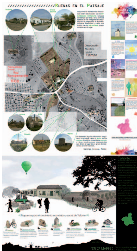
Figura 2. Paneles resumen de 3 trabajos con una reflexión personal.