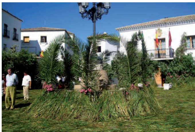
Figura 3: Festividad del Corpus Christi en Zahara de la Sierra.