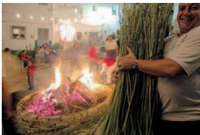
Figura 4: Festividad de la Crujía de los Gamones en Ubrique .