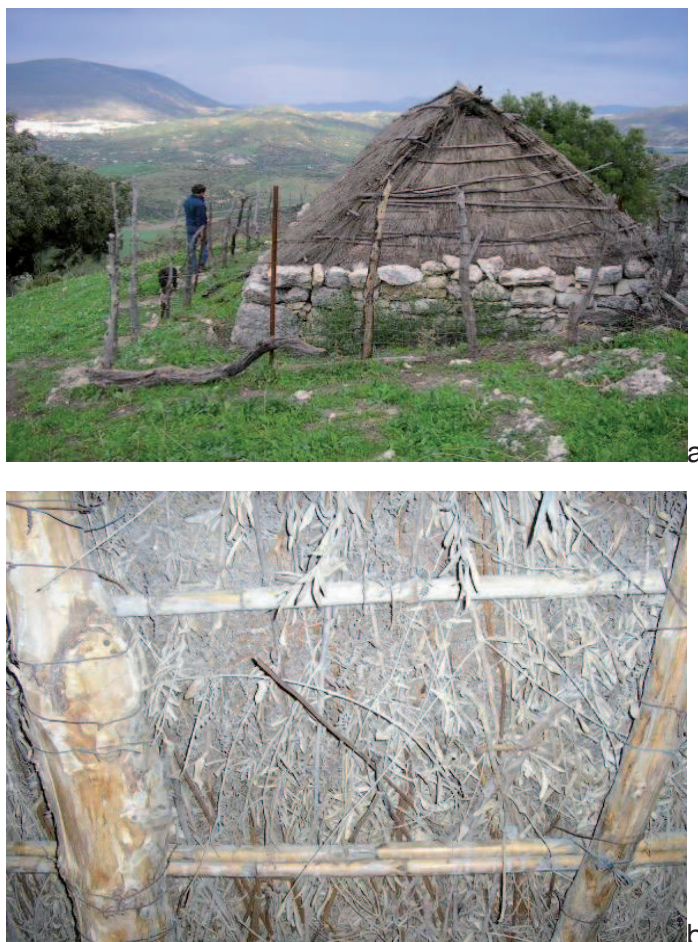
Figura 2: Distintas perspectivas del exterior (a) y techumbre (b) de un chozo.

les tales como el plástico, hormigón y otros elementos utilizados en la construcción, estos usos y conocimientos están quedando en el olvido, no obstante todavía se pueden observar muchos de ellos en el quehacer diario de la Sierra de Grazalema.