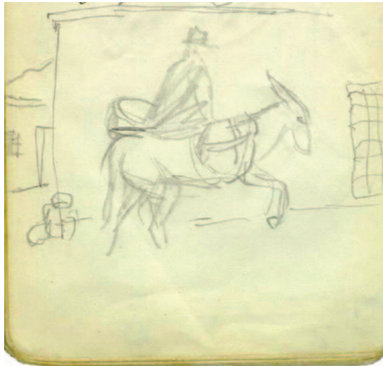
Figura 3: apunte de Le Corbusier de escenas rurales a su paso por Almería, 1931 (Cuaderno B7, W1-1-425, Fundación Le Corbusier).

“Cerca del Almería (dirección Málaga), es el primer cubismo con sus prismas y todos los secretos de su color. Nos quejamos que el cubismo sea desesperadamente intelectualizado. ¡Pero no; Está lleno de la sensualidad de la tierra, de las cosas y de los espectáculos. Está arraigado, enraizado, apasionadamente sentido”