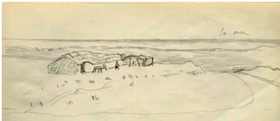
Figura 4: boceto de Le Corbusier de arquitectura vernácula en Motril, 1931 (Cuaderno B7, W1-1-427, Fundación Le Corbusier).