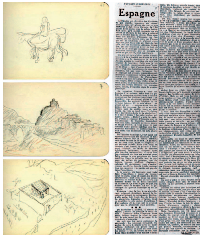
Figura 1: apuntes de Le Corbusier de arquitectura vernácula, paisajes y diversos aspectos del mundo rural español, 1928 (W1-1-678, W1-1-695, W1-1-687 del cuaderno de viaje C-11, Fundación Le Corbusier) y artículo de Le Corbusier publicado en la sección “Voyages d’artistes” del periódico L’intransigeant en el que narra algunas de sus impresiones del viaje realizado a Madrid y Barcelona, 1928 (Le Corbusier, 1928, doc. X1-6-158-001, Fundación Le Corbusier). La impresión que nuestro país ejerció en Le Corbusier quedó reflejada en los dibujos del carnet

Este interés por el paisaje, la arquitectura y las costumbres ibéricas lo constatamos, aún con más intensidad, en la figura de Le Corbusier. Coincidiendo en el mismo año con el congreso de la Sarraz, Le Corbusier visitó por primera vez España: esta visita tuvo lugar en mayo de 1928 para impartir dos conferencias en la Residencia de Estudiantes. En una de ellas, Una Casa-Un Palacio manifestaba su admiración por la casa-tipo de la arquitectura vernácula que satisfacía en grado sumo los principios de economía y claridad geométrica (Le Corbusier, 1983: 38-48). Sus descripciones anticipaban el interés que mostró durante de la década de 1930 por la arquitectura vernácula de las costas francesas y españolas y la arquitectura del norte de África motivada por sus estudios sobre la urbanización de Argel.