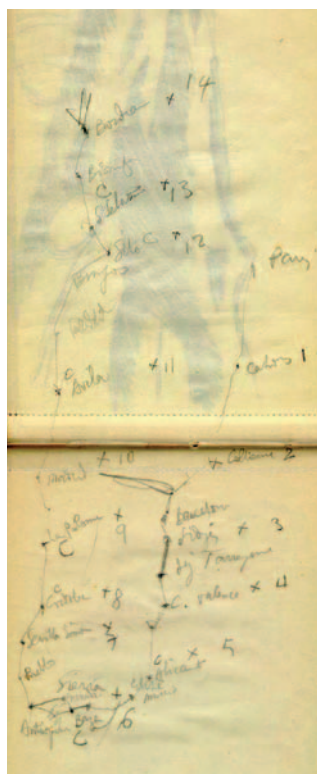
Figura 2: esquema de Le Corbusier de su itinerario por España, 1932 (Carnet B8, W1-1-481 y W1-1-482, Fundación Le Corbusier).

“De todo Toledo, esto: una pequeña casa con un pequeño patio limpio y restregado; me dejan entrar, subir a los pisos minúsculos; está lleno de mujeres y niños; las medidas de estas galerías, de estas alturas de ventanas deliciosas de una vieja casa hispano-árabe, son aquellas que he buscado desde hace diez años para edificar nuestras casas: la escala humana. Me siento reconfortado [...] me parece que sin tener que cultivar la planta (este fenómeno moderno industrial), del que se encargan el Anglosajón y el Germano, se recogerá aquí la flor (literatura, arquitectura). Y la gente de aquí está alimentada de las savias más admirables (árabe, judío, italiano, griego)”