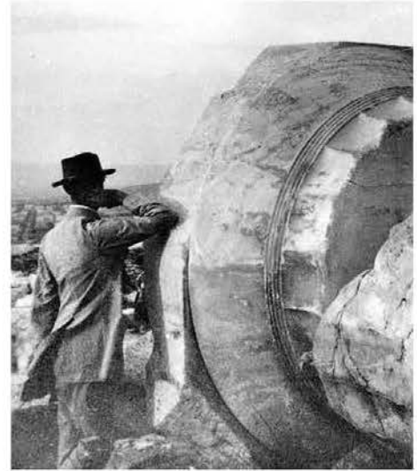
[6] «Y LE CORBUSIER (1887-1965) Y MIES VAN DER ROHE (1886-1969) ¿QUÉ PODRÍAMOS DECIR DE LOS DOS VIEJOS SABIOS? AMBOS, LOS DOS, SE FOTOGRAFÍAN ORGULLOSOS EN LA ACRÓPOLIS, DELANTE DEL PARTENÓN.»

Nace bárbaro el hombre, redímese de bestia cultivándose. Hace personas la cultura y más cuanto mayor. En fe de ella pudo Grecia llamar bárbaro a todo el restante universo. Es muy tosca la ignorancia. No hay cosa que más cultive que el saber. ■