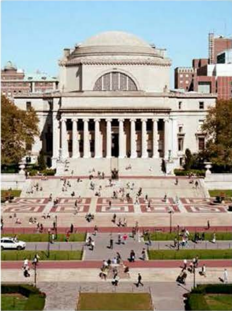
[2] «RECUERDO MI ÚLTIMO AÑO SABÁTICO EN COLUMBIA UNIVERSITY EN NUEVA YORK.» [P+C]

de conocimientos, y para su transmisión. Como el café en grano, que necesita ser seleccionado, tostado, molido, y filtrado con agua caliente hasta obtener el delicioso brebaje. Y, quizás, tras la ingestión de ese café estupendo, las neuronas se despierten y hasta hagan llegar a la sabiduría.