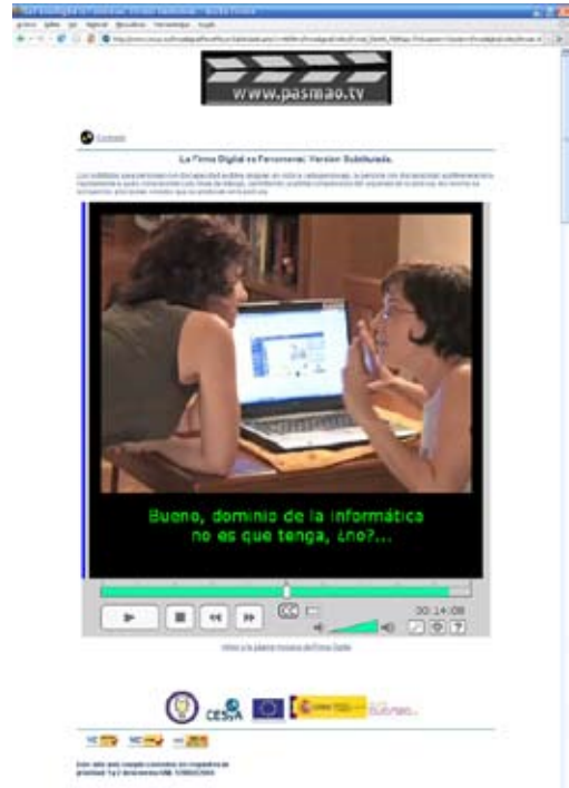
Ilustración 3. Presentación con subtítulos en alta resolución