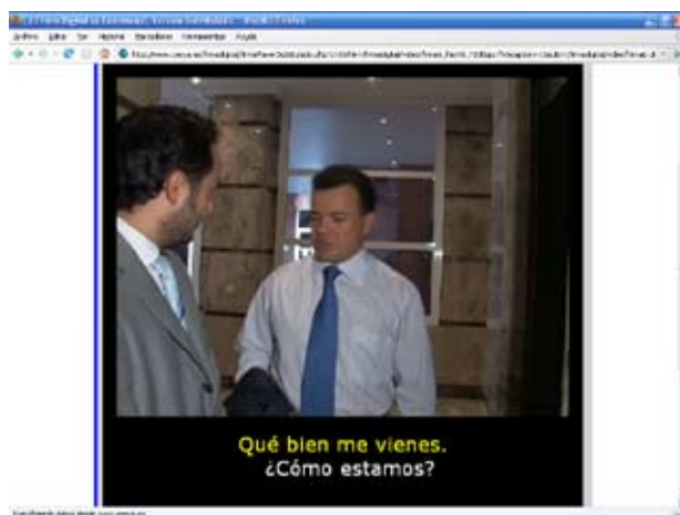
Ilustración 1. Contenidos divulgativos en formato de telecomedia con subtítulos a dos colores

En los contenidos divulgativos se explica a los usuarios en qué consiste el certificado y la firma digital y toda la información relacionada con estas tecnologías, sin incluir información técnica relacionada con su uso. Estos contenidos se muestran a través de una escenificación en formato de telecomedia (Ilustración 1) realizada por personas en situaciones similares a las que se producen en la vida real. Estos contenidos divulgativos han sido subtítulos y audiodescritos: los usuarios podrán elegir cualquiera de las combinaciones posibles.