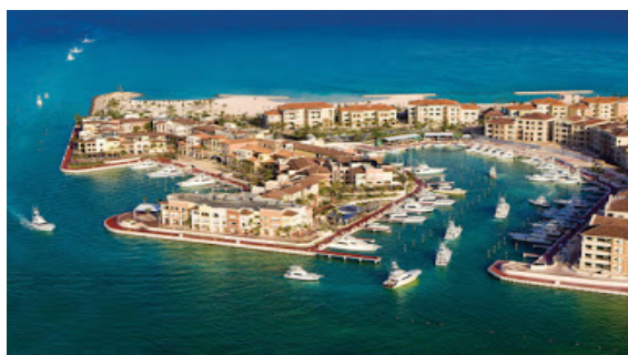
Figura 2. Vista del proyecto turístico Cap Cana.

No obstante, grandes proyectos de inversión turística de gran envergadura se están llevando a cabo en el país, como el proyecto turístico-inmobiliario Cap Cana (complejo turístico y proyecto de villas residenciales), valorado en miles de millones de dólares norteamericanos.