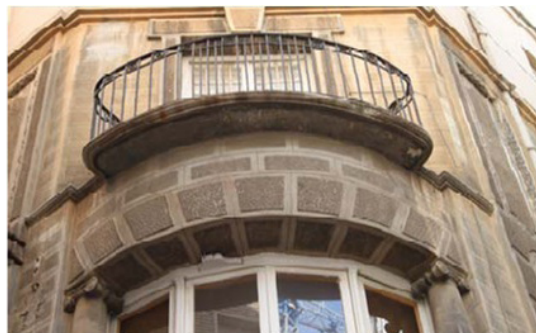
Figura 03: Chaflán Medieras-Escorial, en estado original (detalle).