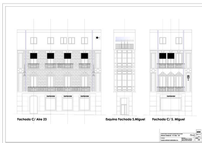
Figura 05.- Alzados de proyecto, estado inicial

El proyecto obtuvo visado en fecha 17 de enero de 2011, y Orden de Ejecución Municipal. Superado el proceso de contratación y exposición pública, la licitación fue adjudicada a la empresa Restauralia Cartago, S.L. Las obras dieron comienzo en junio de 2011.