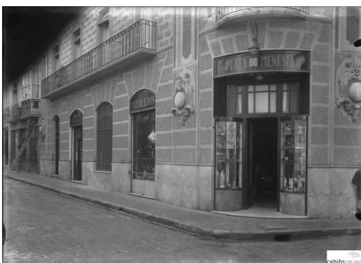
Figura 8.- Deterioro y corrosión de losas de balcones.