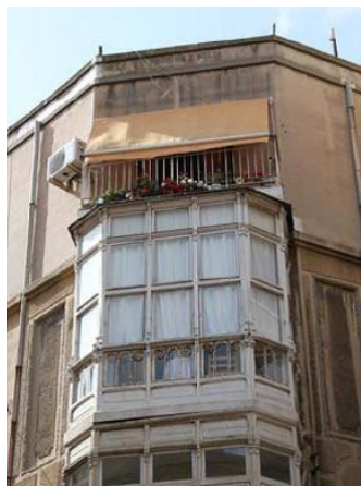
Figura 02: Chaflán Aire-Medieras, alterado por adición de mirador.

Sin embargo, el chaflán que articula las fachadas de Aire y Medieras, se presentaba totalmente alterado, con la adición de un mirador de madera, en plano recto, pasante en las dos plantas de altura, sobre el cual se apoya, en la tercera planta añadida, un balcón de corte recto.