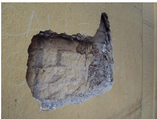
Figura 6.- catas bajo aplacados en planta baja

El resultado de las catas fue contrapuesto en ambos casos. En la parte del chaflán (planta