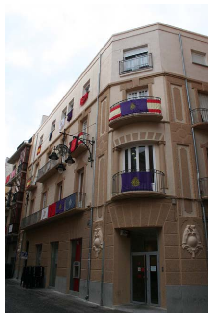
Figura 10 - Imagen final de conjunto.

Una vez conformada la nueva fachada en planta baja, de acuerdo con los criterios generales, se consiguió una imagen global del edificio, totalmente concordante en sus aspectos compositivos, y fielmente adaptada a la documentación histórica encontrada, previa a las intervenciones de modificación del edificio, realizadas a mediados del s.XX.