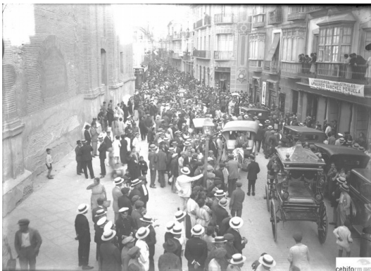
Figura 7.- vista de conjunto. Fotografía entierro Gavira