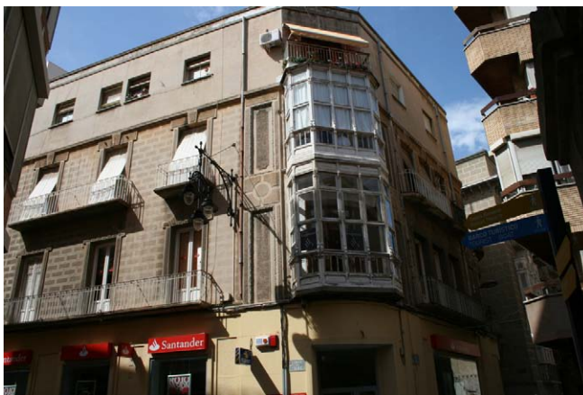
Figura 01: Fachada a calle del Aire, estado inicial.

La planta baja del edificio está destinada a local comercial, destinado en la actualidad en su totalidad a una oficina bancaria, que también ocupa parte de la planta primera. En el momento de abordar la restauración, la planta baja disponía de un tratamiento material totalmente diferente a las plantas superiores, constando de un aplacado de piedra artificial armada, imitando almohadillados, y respetando la composición de ejes de huecos.