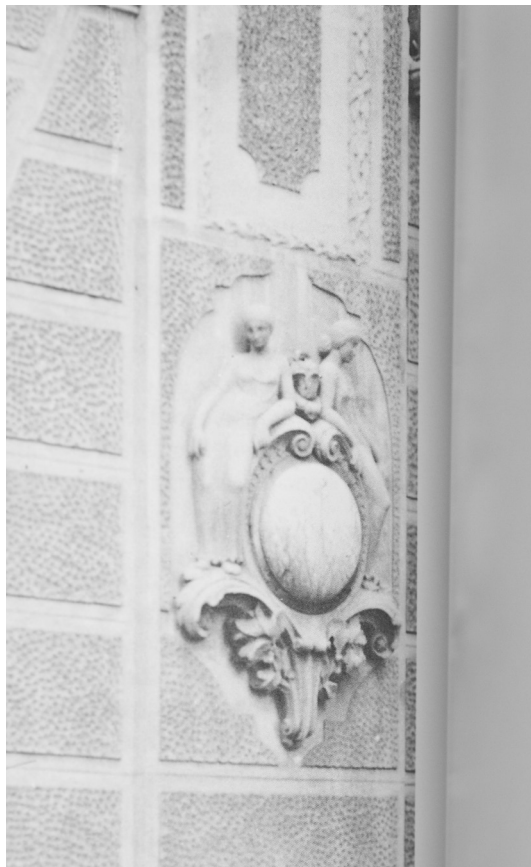
Figura 9.- Detalle medallón escultórico en planta baja.

en la medida de lo posible, la edificación a su estado original, desmontando los aplacados de planta baja, reponiendo el tratamiento de mortero bastardo con almohadillado y bajorelieves, así como la recreación de los 6 medallones escultóricos.