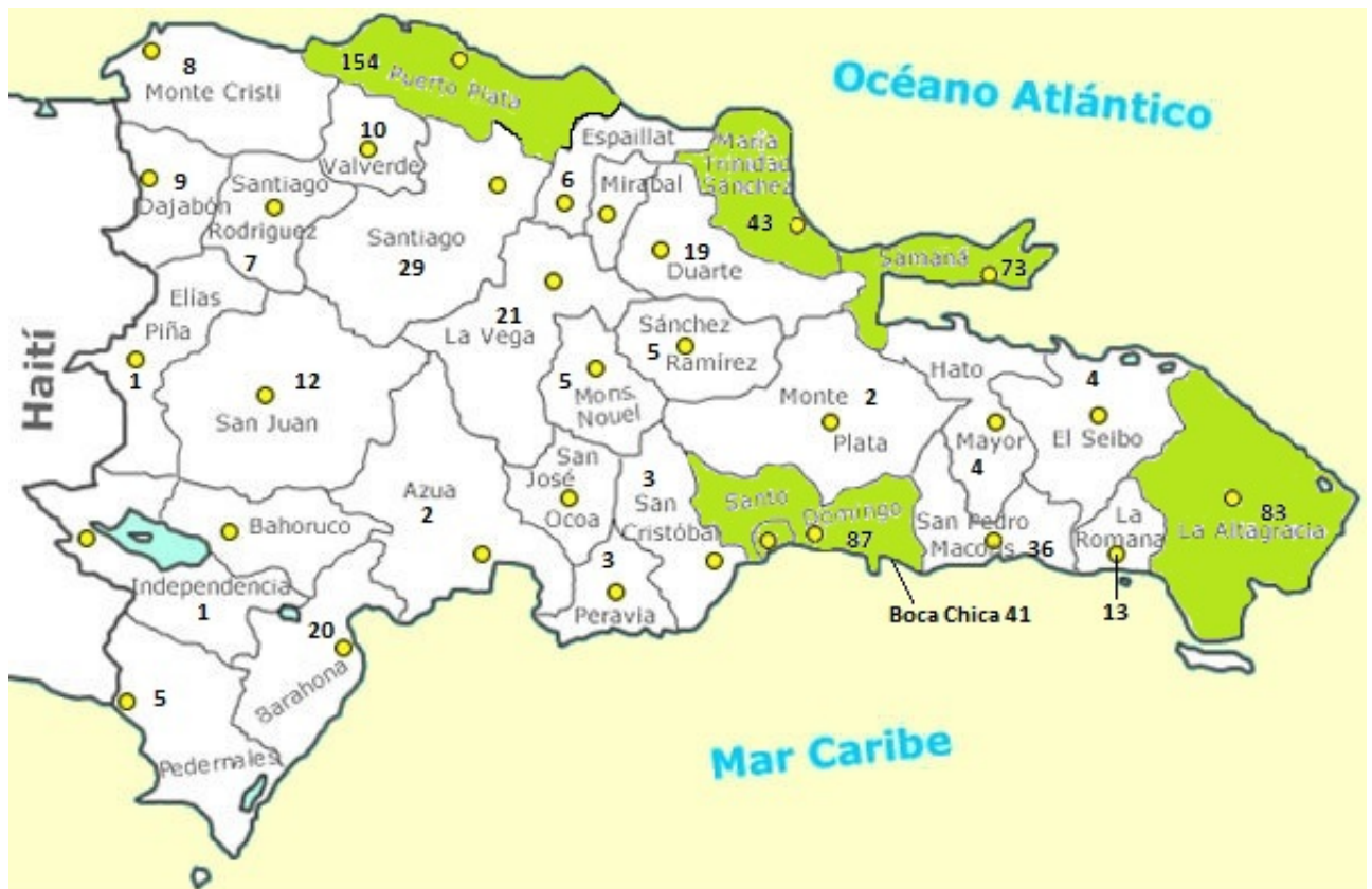
Gráfico Distribución Geográfico de Habitaciones de Hoteles (Año 2010)

Como podemos observar en el gráfico hay tres zonas donde el turismo y el número de plazas son más relevantes. La provincia de Puerto Plata es la primera en el desarrollo del turismo en el país, pero no se encuentra en su mejor momento, ya que los turistas prefieren visitar los diferentes atractivos con los que cuenta la provincia La Altagracia, ya que los turistas prefieren las playas del este, y por esta razón Puerto Plata se ve afectada, esta cuenta con mayor número de hoteles y habitaciones, pero menor número de visitas de turistas.