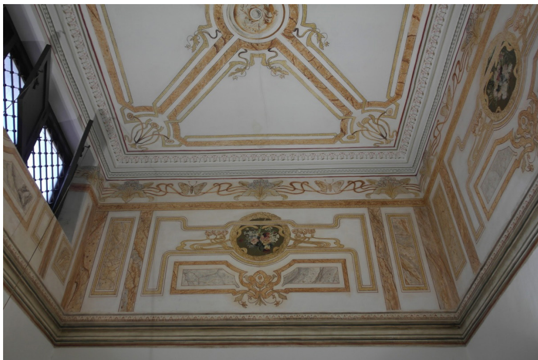
Figura 3. Remate superior de la escalera de nuestra Sede Social, decorado con pinturas de estilo modernista.

de estilo secessionista. En nuestra Sede Social, estas pinturas estilizadas se localizan principalmente en la techumbre del zaguán –donde la inclusión de un plafón de características modernistas hace pensar que se retocara durante 1905-, y en el dormitorio principal. En esta primera estancia son muy patentes los motivos curviformes y fitomórficos levemente perfilados y muy estilizados que indican una clara dependencia formal de algunas obras valencianas. En el dormitorio principal de la casa también podemos encontrar estas formas en la moldura, con unas estilizadas margaritas que se agarran con potentes raíces que podrían aludir a la fecundidad y que destacan por su esmerado trabajo. Asimismo, sobre éstas se da un techo pintado con formas abstractas y motivos curvos en este estilo. Estas paredes del dormitorio principal parecen que –en un principio- estuvieron decoradas con frescos, pero éstos se debieron estropear y se cubrieron con papel pintado.