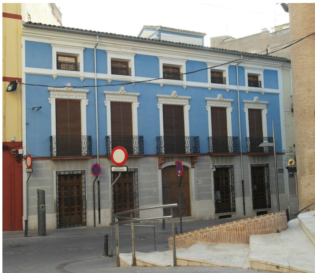
Figura 1. Sede Social de la Comparsa de Labradores de Villena.

Los bienes que lo integran constituyen un legado patrimonial de gran valor. Por ello, y para su conservación y tutela, se creó la Comisión de Patrimonio, organismo perteneciente a la comparsa cuyo objeto es la protección, conservación, difusión, fomento, investigación, gestión y acrecentamiento de su patrimonio. Entre estos bienes patrimoniales hay elementos de valor histórico, artístico, musical, gastronómico, arquitectónico, etnológico, documental, pictórico, gráfico y bibliográfico. Además, también forman parte de nuestro patrimonio cultural —en calidad de bienes inmateriales—, las creaciones, conocimientos, técnicas, prácticas y usos más representativos y valiosos de los rituales festivos y formas de representación de la participación en la fiesta de nuestra comparsa y de la cultura tradicional villenense (García, 2016, 10).