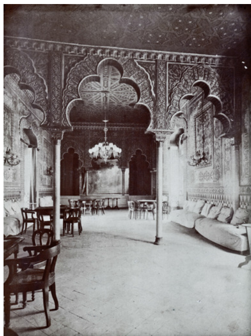
Figura 1. Salón árabe del Centro Dertocense o Sociedad el Casino de Tortosa: La Alhambra Tortosina