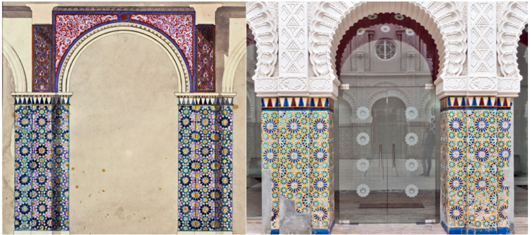
Figura 2. A la izquierda, lámina con el diseño de arcos para un patio que nunca se llegó a construir (autor: Owen Jones, origen: Victoria and Albert Museum. London). A la derecha, arco principal de planta baja del patio de la Casa Dorda de Víctor Beltrí (autor: David Morral)