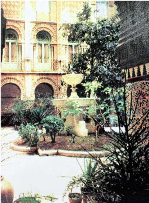
Figura 10. Fuente del patio de la Casa Dorda de Víctor Beltrí

bre de Muhammad V)”. En las inscripciones de planta primera, en cambio, la primera “recoge la segunda mitad del lema solamente”, la segunda “la réplica está muy distorsionada y truncada”, y la tercera “está muy alejada del original y carece de contenido”. Y finalmente, nos dice que las inscripciones de planta segunda “hay algunas letras del lema y atauriques sueltos”.