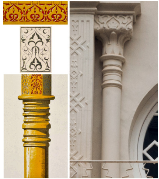
Figura 5. A la izquierda, de arriba a abajo, detalle a color de la Sala de Los Embajadores, detalle de la Sala de La Barca y detalle a color de la Sala de Los Embajadores y de Las dos Hermanas de la Alhambra, "Plans, elevations, sections and details of the Alhambra" (autor: Owen Jones, origen: Biblioteca del Patronato de la Alhambra y Generalife. Granada). A la derecha, detalle de una columna y capitel de planta primera del patio de la Casa Dorda de Víctor Beltrí (autor: David Morral)

Durante su periodo de estudiante en la escuela de arquitectura, pudo ver, oír y estudiar los libros del arquitecto inglés Owen Jones: "Grammar of ornament", "Designs for mosaics and tessellated pavements" y "Plans, elevations, sections and details of the Alhambra", libros considerados obras de arte en sí mismos, en los cuales Beltrí pudo aprender mucho sobre la geometría y la arquitectura árabe y morisca sin necesidad de desplazarse a la Alhambra, gracias a la precisión y detalle de Owen Jones a la hora de ejecutar sus láminas a color.