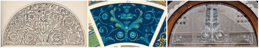
Figura 9. De izquierda a derecha, Fragment in White Marble from the Mattei Palace, Roma – L. Vulliamy pág. 43, detalle de la lámina RENAISSANCE Nº5, “Grammar of ornament” (autor: Owen Jones, origen: Biblioteca Nacional de España. Madrid). Detalle de la cristallera de la puerta de acceso al patio interior en planta baja de la Casa Dorda de Víctor Beltrí (autor: David Morral)