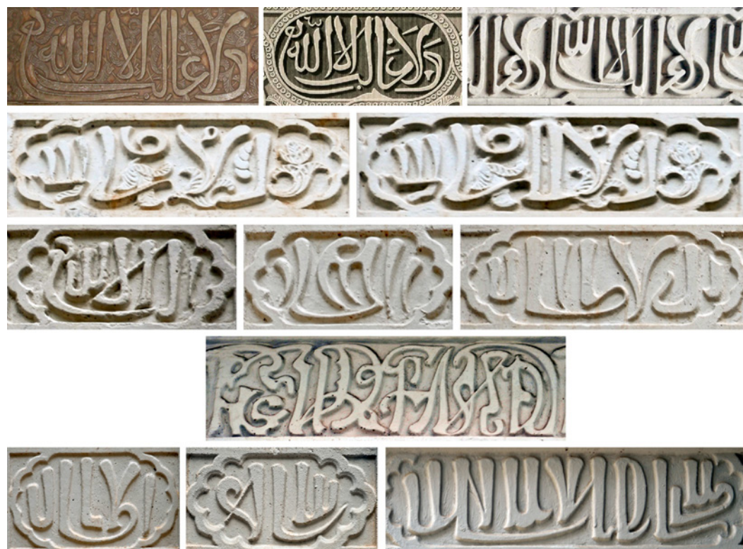
Figura 8. En la fila superior, de izquierda a derecha, lema nazarí en La Alhambra de Granada (autor: David Morral), detalle de Plate 2 N°3, “Plans, elevations, sections and details of the Alhambra” (autor: Owen Jones, origen: Biblioteca del Patronato de la Alhambra y Generalife. Granada). A la derecha, detalle del lema nazarí en planta segunda del patio de la Casa Dorda de Víctor Beltrí (autor: David Morral). En segunda, tercera, cuarta y quinta filas, de arriba a abajo, inscripciones en pilares y pilastras de planta segunda, inscripciones en pilares y pilastras de planta primera, inscripciones bajo imposta de planta baja-primer planta, inscripciones en pilares y pilastras de planta baja del patio de la Casa Dorda de Víctor Beltrí (autor: David Morral)