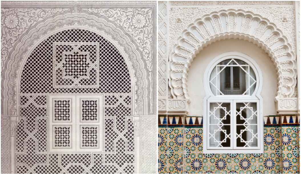
Figura 7. A la izquierda, detalle de la Sala de Las dos Hermanas de la Alhambra, “Plans, elevations, sections and details of the Alhambra” (autor: Owen Jones, origen: Biblioteca del Patronato de la Alhambra y Generalife. Granada). A la derecha, detalle de una ventana en planta baja del patio de la Casa Dorda de Víctor Beltrí (autor: David Morral)

Encontramos también gran similitud entre el arco de la Puerta Principal o de la Justicia de la Alhambra grafiado en “Plans, elevations, sections and details of the Alhambra” de Owen Jones y el diseño que hizo Beltrí en la Casa Dorda para los arcos de planta segunda, arcos más sencillos que los de planta baja o primera. La diferencia más notable la encontramos en que el arco del dibujo de Owen Jones carece de decoración, en cambio los arcos de planta segunda del patio de la Casa Dorda de Beltrí están decorados con el mismo criterio que los arcos de planta baja y primera, dotando al conjunto de una perfecta armonía.