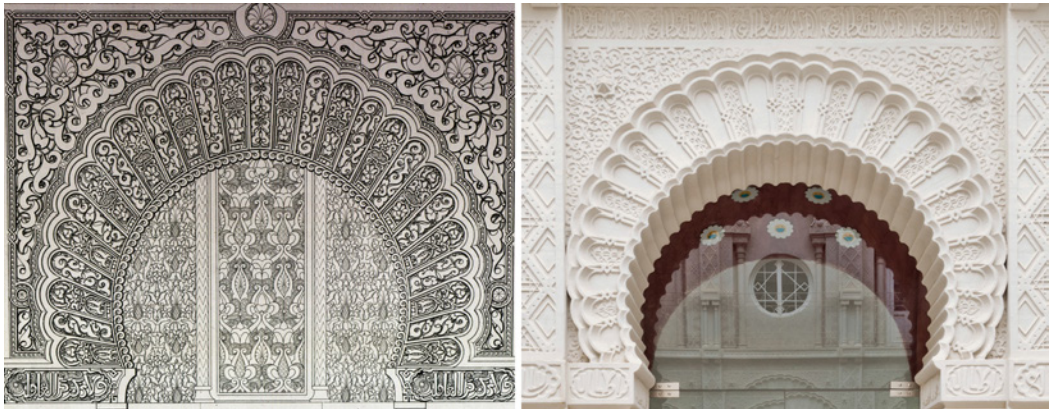
Figura 3. A la izquierda, ardo de la Mezquita de la Alhambra, “Plans, elevations, sections and details of the Alhambra” (autor: Owen Jones, origen: Biblioteca del Patronato de la Alhambra y Generalife. Granada). A la derecha, arco principal de planta baja del patio de la Casa Dorda de Víctor Beltrí (autor: David Morral).

tos se encontraba en plena reconstrucción tras la Guerra Cantonal y con una economía floreciente como consecuencia del auge de la industria minera, lo que propició la aparición de una nueva y acaudalada burguesía.