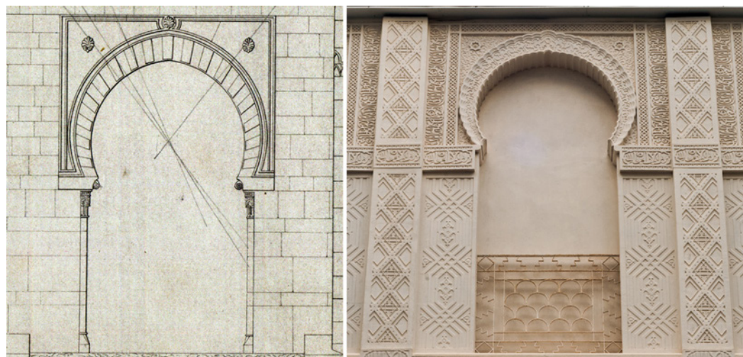
Figura 4. A la izquierda, arco de la Puerta principal o de justicia de la Alhambra, “Plans, elevations, sections and details of the Alhambra” (autor: Owen Jones, origen: Biblioteca del Patronato de la Alhambra y Generalife. Granada). A la derecha, arco en planta segunda del patio de la Casa Dorda de Víctor Beltrí (autor: David Morral)

Lo más singular de esta construcción es su patio interior de estilo árabe, inspirado, según varias fuentes, en la Alhambra de Granada, la Mezquita de Córdoba y el Palacio de la Aljefaría de Zaragoza.