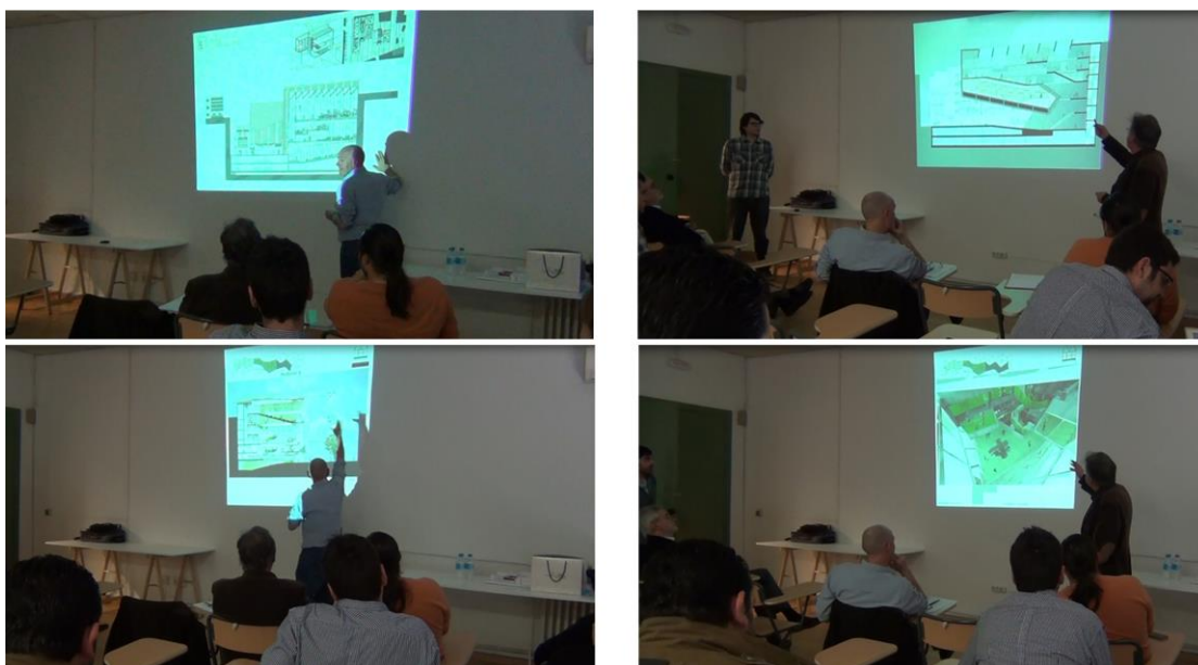
Sesiones Jury invierno 2013

Cada alumno explicará o “defenderá” su proyecto ante los profesores invitados al Jury, resto de profesores y compañeros. Como ya se ha comentado, cuentan con total libertad en cuanto a herramientas o medios para apoyar su explicación oral con una presentación. Es un momento importante para los alumnos seleccionados, se pueden sentir “premiados”. Es su primera aproximación a un situación profesional real: ganar un concurso o resultar preseleccionado. En experiencias previas se han obtenido buenos resultados, alcanzado un buen nivel tanto en comunicación oral como gráfica, en una situación que no puede producirse en las actividades cotidianas de la asignatura.