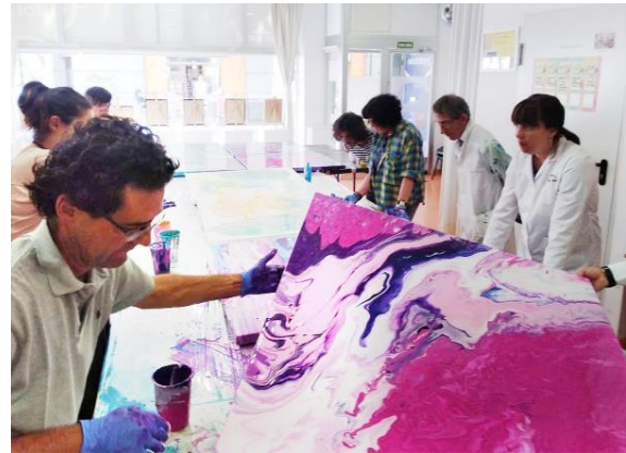
Figura 3. Proceso de trabajo artístico comunitario entre los creadores del taller. Espacio Visiones (Zaragoza, 2018).

Una fabulosa oportunidad de explotar conscientemente el inconsciente y de experimentar de primera mano, la singular conexión entre el arte de vanguardia y las creaciones más primitivas del Art brut