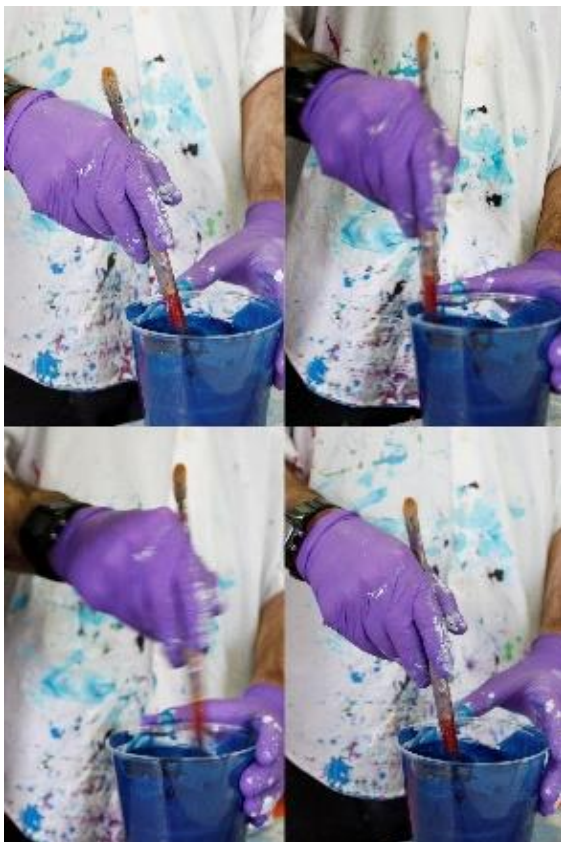
Figura 2. Proceso de mezcla de colores con pintura acrílica y gel medium. Espacio Visiones (Zaragoza, 2018).

Para nosotros, que al igual que los pintores románticos y surrealistas, siempre hemos asociado el genio y el delirio al concepto de libertad absoluta, la idea de trabajar con artistas diagnosticados como enfermos mentales, suponía de algún modo, el hype que ofrece el acceso directo al inconsciente.