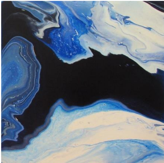
Figura 4. Sisal (36.2018) Pintura acrílica sobre lienzo 100x100cm. 2018.

Así serían también las creaciones que nosotros desarrollaríamos para nuestro proyecto, de manera colectiva y donde la máxima importancia debería recaer en el proceso. La mera intención de pintar como acto artístico, revela ya de por sí, un proceso creativo comparable con la más pura improvisación no idiomática.