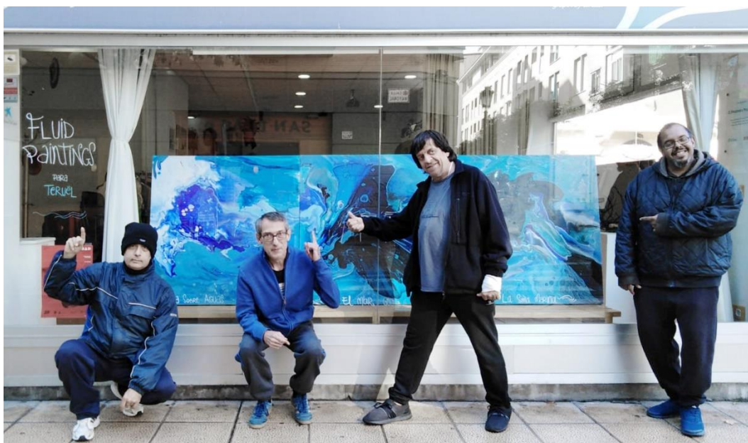
Figura 1. Inauguración exposición 'Out of the Blue. Arte Fluido'. Espacio Visiones (Zaragoza, 2018)