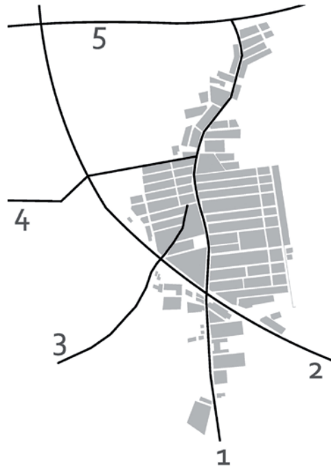
Fig. 2 Barrio de Peral (1900) 1. Camino de la Ribera 2. Vías del tren 3. Camino a San Antonio Abad 4. Camino de los Barreros 5. Vereda de San Félix

La parte del barrio que se va estudiar, queda acotada al sur por la línea del ferrocarril que divide el barrio en dos, y al norte por la primera zona en consolidarse que llega hasta la vereda de San Félix. A pesar de ser la zona norte la más antigua, no es hasta el desarrollo de la parte a analizar, cuando estas construcciones reciben la categoría de barrio. Esto se debe a que en este periodo (1890-1910), es cuando se van a construir las nuevas calles, rotular las antiguas, así como creación de fábricas y dotaciones (tiendas, iglesia, casino).