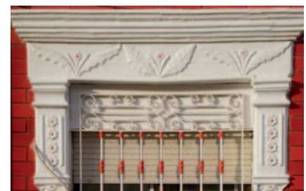
Fig. 5 Detalle ornamental de una vivienda en medianera

El Barrio de Peral es el último en formarse, ya que a diferencia del resto de barrios no está próximo a la ciudad, ni conectado por ningún viario de importancia. Su buena ubicación geográfica, en lo alto de una colina y atravesado por la línea de ferrocarril que lleva a Murcia, será un factor importante, que lo va a diferenciar socioeconómicamente del resto. Además de obreros y agricultores enriquecidos, este paraje va atraer a una sociedad burguesa, la cual invertirá dinero elevando la calidad de las construcciones y de las dotaciones, como la iglesia, el casino o el cinematógrafo.