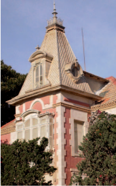
Fig. 4 Chalé Cervantes en la Plaza Canthal

En 1898 surge en el barrio la sociedad Cervantes un grupo teatral y musical. Dos años después a pocos metros del casino se inaugura el cinematógrafo. Esta sucesión de equipamientos relacionadas con el ocio, nos permite imaginar un barrio dinámico, lleno de vida, apoyado por una burguesía, que ayudaba económicamente en la mejora de las infraestructuras.