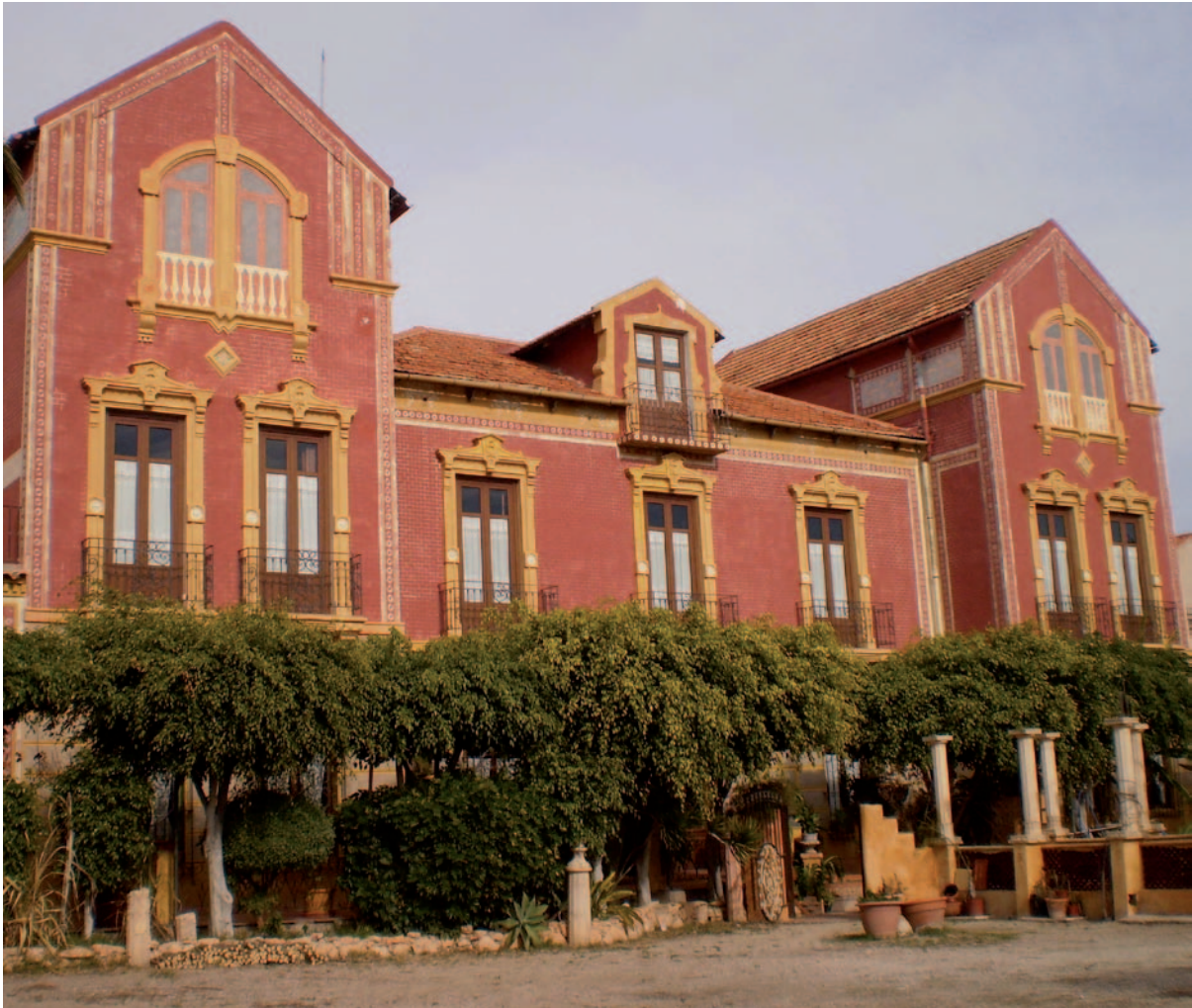
Fig. 6 Villa Esperanza