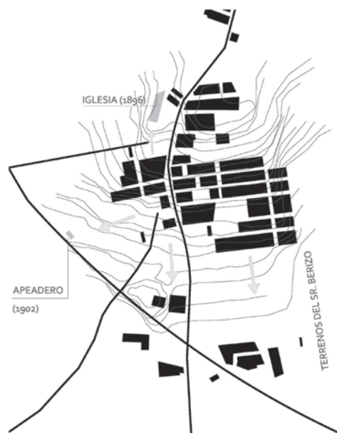
Fig. 3 Desarrollo del Barrio de Peral (1887)