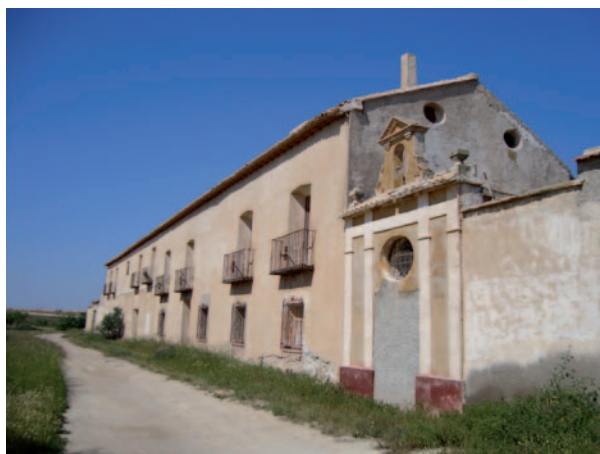
Figura 7: Importante hacienda con ermita. Lo Jordán (Corvera).

PROTOTIPO 6: CASAS ADOSADAS DOS PLANTAS. Este tipo de construcciones son difícil de encontrar. Las casas serían de propietarios agrícolas que trabajarían en la misma finca que tendrían gran cantidad de terreno que cultivar y numerosas cabezas de ganado con un redil en la parte de atrás, atestigua la importancia de este tipo de casas de labradores o de pastores.