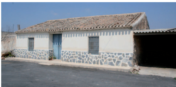
Figura 5: Casa adosada en la población de El Escobar (Fuente Álamo).

PROTOTIPO 4: CASAS ADOSADAS UNA PLANTA EN POBLACIÓN. Dentro de una población rural, las casas aparecen de forma individual o adosadas unas con otras, formando un núcleo de población compacto. Por lo normal, y dependiendo del poder adquisitivo, aparecen casas con tejado a dos aguas con una simple ventana en su fachada principal o con dos, así como puerta para resguardar el carro y el patio en la parte trasera.