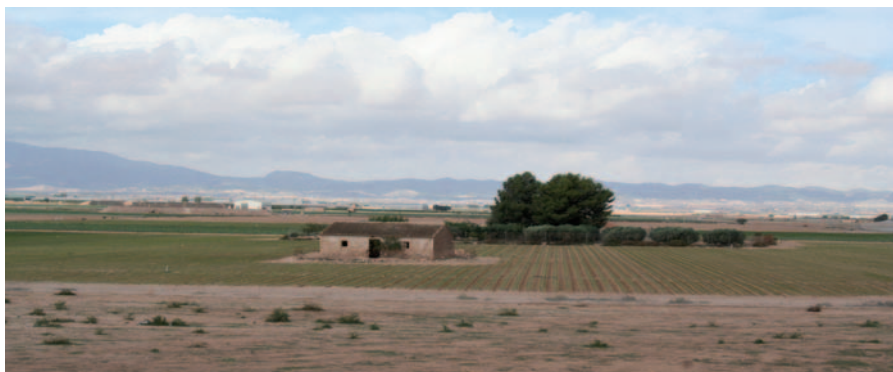
Figura 1: Paisaje cultural acotado por la omnipresente sierra del norte o de Carrascoy.

La Ley regional 4/2007 define el Patrimonio Cultural como la amplitud de valores que definen el patrimonio cuya naturaleza no se agota en el puramente histórico o artístico. Es el constituyente una de las principales señas de identidad de la misma y el testimonio de su contribución a la cultura universal. Los bienes que lo integran constituyen un patrimonio de inestimable valor cuya conservación y enriquecimiento es precisa. Esta ley fomentará las peculiaridades culturales, así como el acervo de costumbres y tradiciones populares de la misma, respetando en todo caso las variantes locales y comarcales. Tiene cabida la protección del paisaje cultural, como porción de territorio rural, urbano o costero donde existan bienes que por su valor histórico, artístico, estético, etnográfico o antropológico e integración con los recursos naturales o culturales merece un régimen jurídico especial. Y lo que concierne al patrimonio etnográfico es aquel paraje natural, conjunto de construcciones o instalaciones vinculadas a formas de vida, cultura y actividades propias de un territorio.