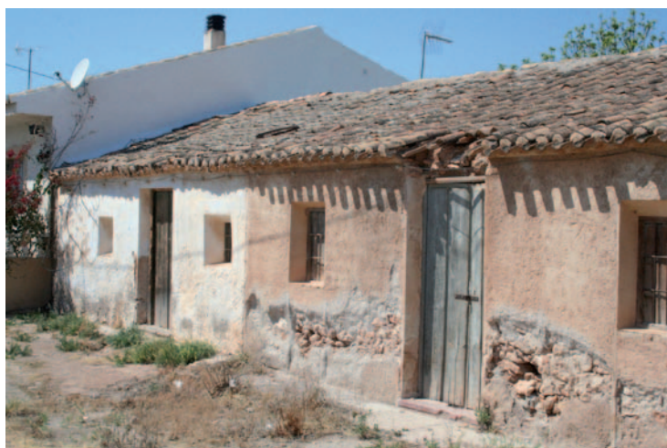
Figura 4: Casas adosadas de una planta en Balsapintada.

PROTOTIPO 4: CASAS ADOSADAS UNA PLANTA EN POBLACIÓN. Dentro de una población rural, las casas aparecen de forma individual o adosadas unas con otras, formando un núcleo de población compacto. Por lo normal, y dependiendo del poder adquisitivo, aparecen casas con tejado a dos aguas con una simple ventana en su fachada principal o con dos, así como puerta para resguardar el carro y el patio en la parte trasera.