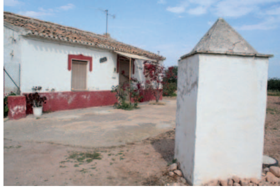
Figura 10. Pozo junto a las inmediaciones de la casa. El Castillejo (El Albuñón).

Las balsas de forma circular o rectangular constituyeron uno de los elementos más importantes de la hacienda rural cartagenera. En ella el agua de lluvia o extraída a través de norias (fuerza animal o del viento) era depositada para su uso doméstico y agrario.