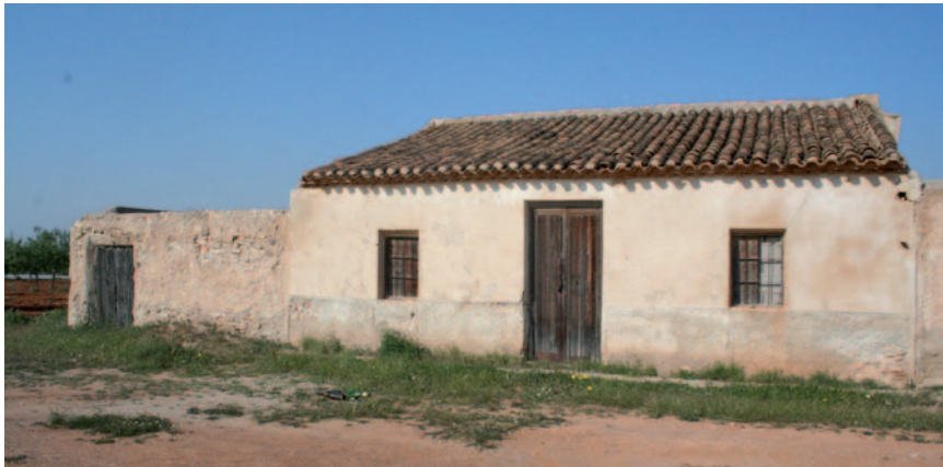
Figura 3: Casa exenta de una planta con corral para los animales. Los Sánchez (San Isidro).

PROTOTIPO 3: CASAS ADOSADAS DE UNA PLANTA. Este tipo de casas corresponde al mismo sistema que el anterior con la salvedad que se encuentran adosadas varias casas que corresponderían a diversas familias, debido a la extensión de terreno no tendrían la necesidad de incorporar más altura en la construcción de sus casas lo que llevaría aparejado un mayor costo. Este tipo arquitectónico es muy común observarlo en muchas zonas de la Región de Murcia y por ende en el Campo de Cartagena. Siendo una casa más principal que la otra.