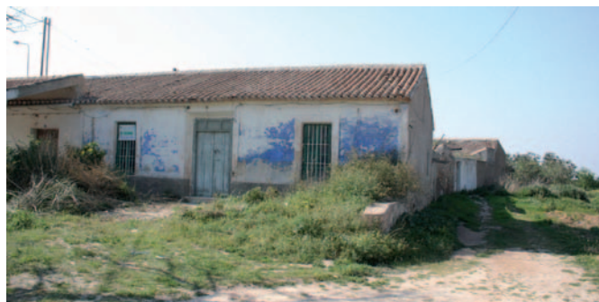
Figura 11. Fachada en la que se aprecia restos de color azul en su fachada. Tallante.

Los colores tradicionales que han pintado nuestra arquitectura popular proceden de la mezcla de varios elementos que se dan en la naturaleza. Las fachadas presentarán una terminación de enfoscados o estucados de morteros de cal, en ocasiones coloreados en tonos que mantienen los colores tradicionales como almagra o almagro (se compone de óxido rojo de hierro mezclado con arcilla y alúmina, abundante en la naturaleza), añil u ocre. Colores que los ayuntamientos españoles de ciudades con casco histórico tanto persiguen para que la rehabilitación de sus fachadas sean como los tonos originales. La importancia del uso de colores fríos como los azules y blancos en fachadas servía para aminorar la irradiación de sol y producir más sensación de fresco en los días calurosos. Estos enlucidos ocultan la mampostería, es la obra de albañilería realizada con piedras, sin un orden preestablecido y unidas todas ellas por argamasa de agua, cal y arena.