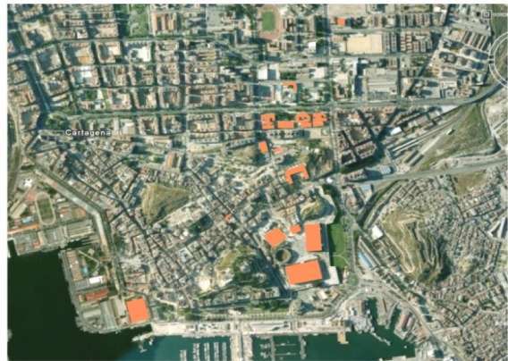
Fig 1. Imagen aérea del casco antiguo de Cartagena. Distribución de instalaciones universitarias en la trama urbana.

La Universidad no solo actúa de protección y control de la evolución de la investigación científica, de centro de elaboración cultural y de referente y ayuda a la comprensión de la evolución de la técnica y de la ciencia, sino que además adquiere funciones urbanas, facilitando y mejorando el funcionamiento de la comunidad. Para la Universidad ha constituido un polo de atracción muy fuerte edificios que por su dimensión y función anterior constituían más un problema que una oportunidad, por ejemplo el Cuartel del Antigüones, Hospital de Marina, o Cuartel de Instrucción de Marina. Ha demostrado poseer instrumentos y medios para intervenciones cualificadas en ámbitos espaciales que han perdido su funcionalidad.