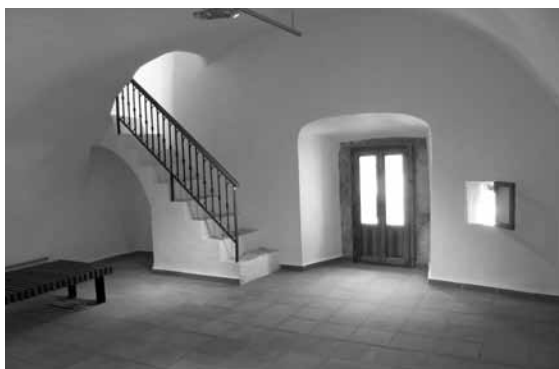
Figura 7. Planta alta de la torre, tras la intervención.