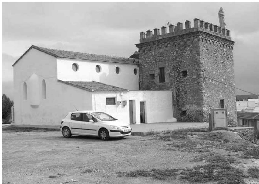
Figura 2. Vista general del conjunto desde poniente antes de la intervención

En general, su estado de conservación era relativamente bueno, ya que se encontraba en uso. No obstante requería actuaciones de mejora, fundamentalmente en cuanto a tratamiento de humedades en muros, reposición de instalaciones, reposición de cubiertas, pavimentos, etc., y fundamentalmente devolver el estado interior original, sin las particiones del uso actual como apartamento.