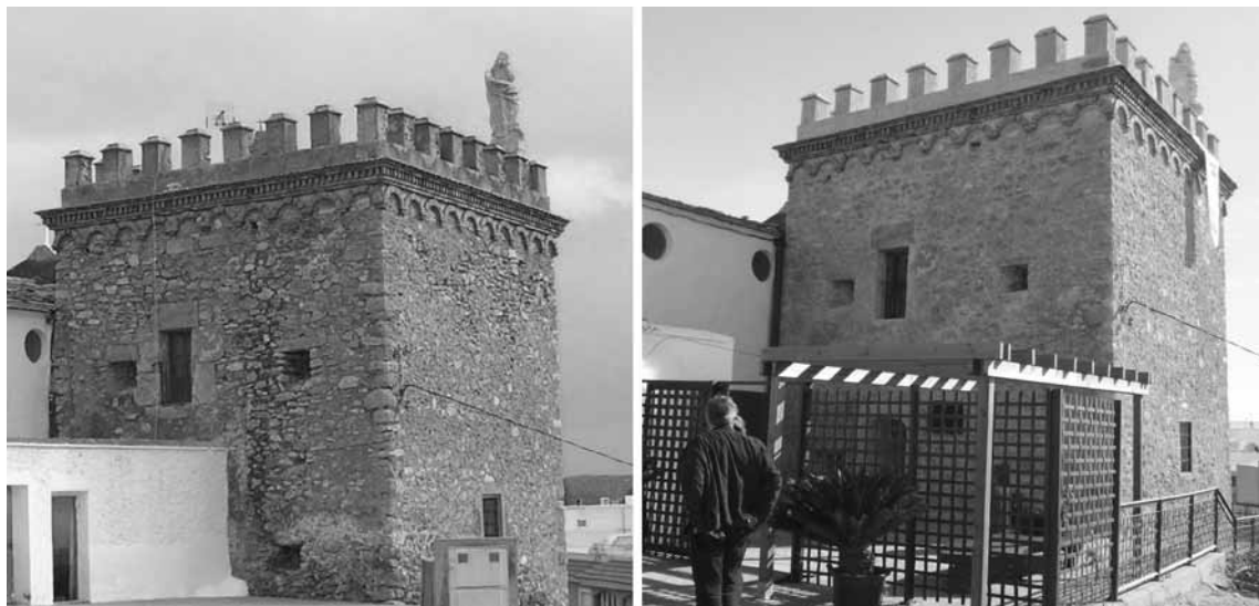
Figura 3. Vista general de la torre, antes y después de la actuación.