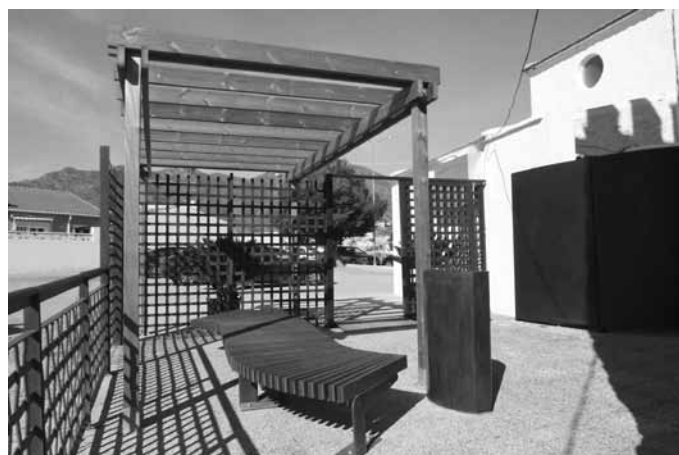
Figura 10. Vista general del patio de acceso a la Torre después de la intervención.