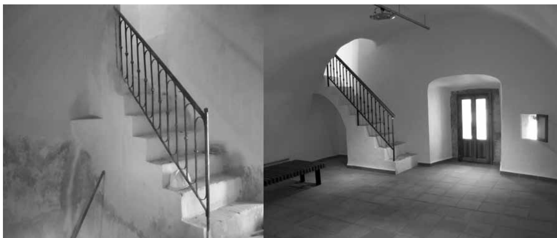
Figura 5. Interior de la torre, planta baja, antes y después de la actuación.