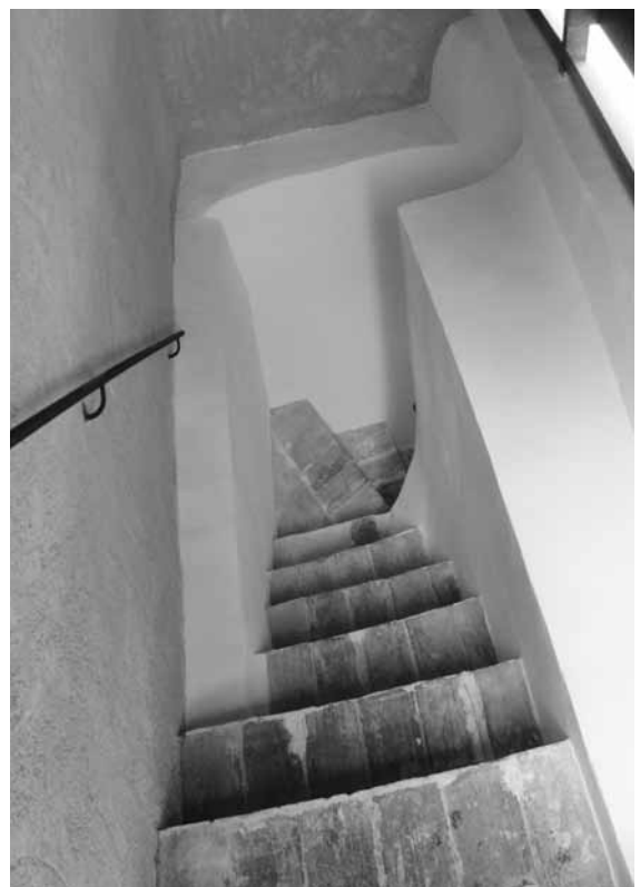
Figura 8. Interior del tramo de escalera de acceso a cubierta.