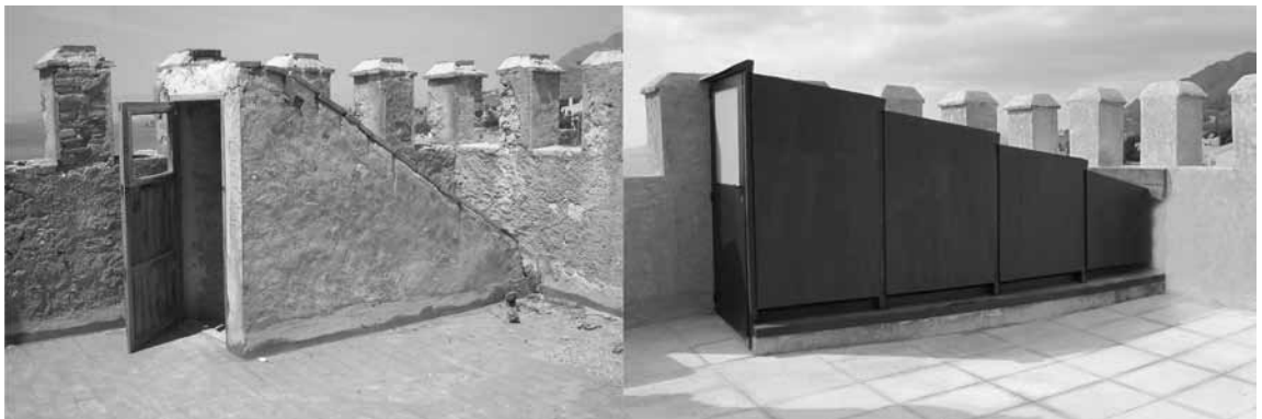
Figura 6. Cubierta de la torre y salida de escalera, antes y después de la actuación.