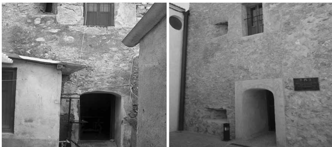
Figura 4. Vista general de la zona de patio y entrada, antes y después de la actuación.