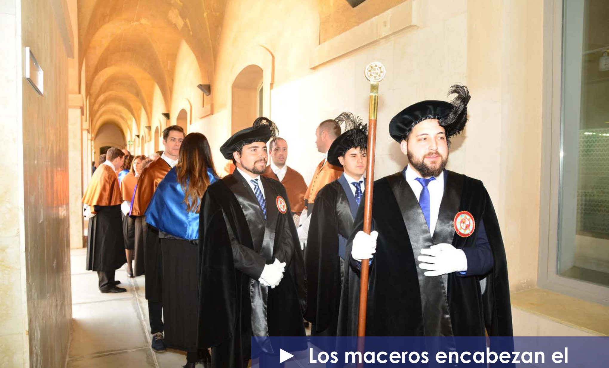
► Los maceros encabezan el cortejo hasta el Paraninfo