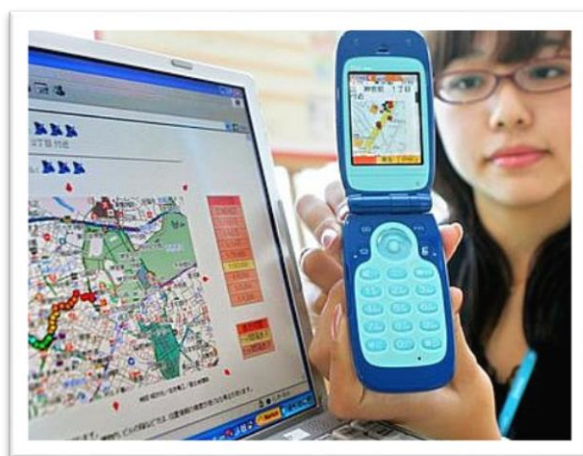
Ilustración 6 Localizador de niños con GPS.

Normalmente va conectado al móvil de los padres, pero si lo quisiesen podría poner directamente el número de una central receptora de alarmas.