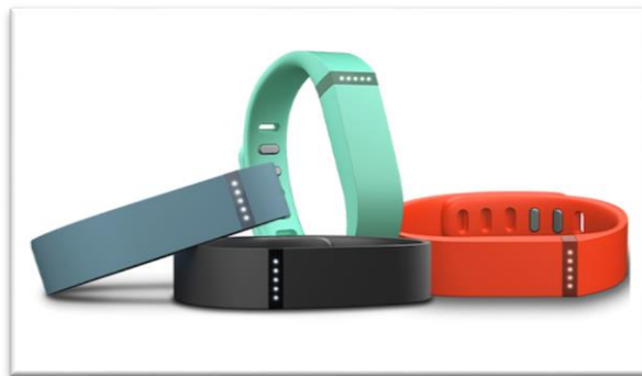
Ilustración 2 Controlan parámetros de salud

Esta es la principal función de la pulsera, en la que además se pueden registrar las estadísticas y resultados, estas utilidades se pueden fomentar a través de las aplicaciones de móviles.