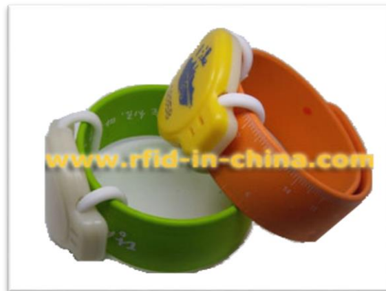
Ilustración 3 Obtener las entradas de los parques de atracciones

La empresa RFID DIARIO ha lanzado el Wristband del HF RFID (10), para agilizar la entrada a lugares con aglomeraciones en la entrada, para efectuar el pago o la adquisición de la misma. Lo que le ha gustado mucho a los dueños de los parques de atracciones ya que es una forma muy segura a la hora de evitar falsificaciones.