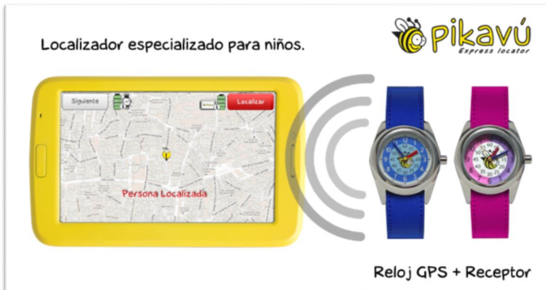
Ilustración 5 Localizador especializado para niños