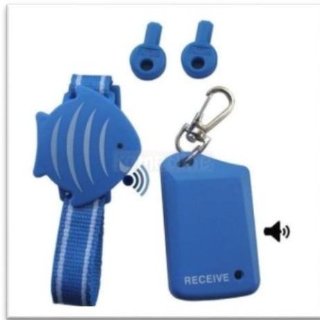
Ilustración 7. Localizador de niños con alarma.

Ha sido diseñada tanto para niños como para mascotas.