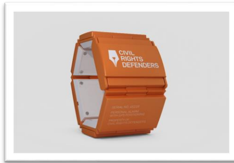
Ilustración 1 Avisa en situaciones de riesgo.