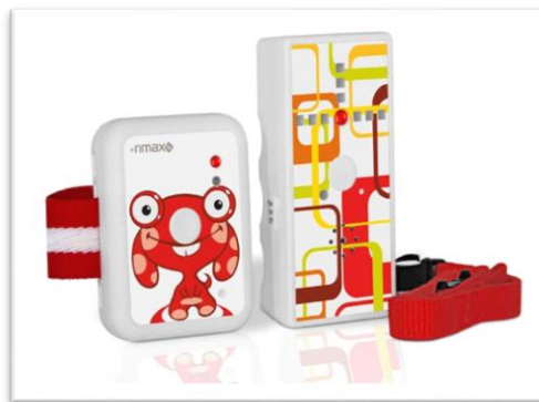
Ilustración 8. Localizador infantil kids alarma

Es prácticamente similar a uno de los anteriores, consta de una pulsera que se coloca al niño y lleva un transmisor y el adulto lleva el receptor de las señales del niño.