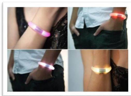
Ilustración 4. Informa de los avisos del móvil

Es un dispositivo muy sencillo conectado a nuestro móvil mediante bluetooth. Estará en el mercado a finales de año 2.013, estará en varios colores y es compatible tanto para Apple a partir de iOS 5, como para Android, un detalle interesante es que se podrá personalizar los colores de las notificaciones, la intensidad del brillo o el número de parpadeos de las luces en función de la aplicación que sea.