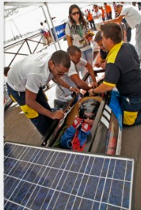
Los miembros del equipo, durante la presentación del prototipo en el Hospital de Marina. A la derecha y abajo, imágenes de la carrera disputada en el Circuito de Velocidad de Cartagena