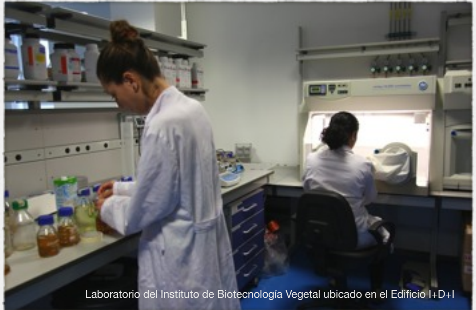
Laboratorio del Instituto de Biotecnología Vegetal ubicado en el Edificio I+D+I

Más de la mitad de los graduados entrevistados califican su satisfacción general con la titulación estudiada y las