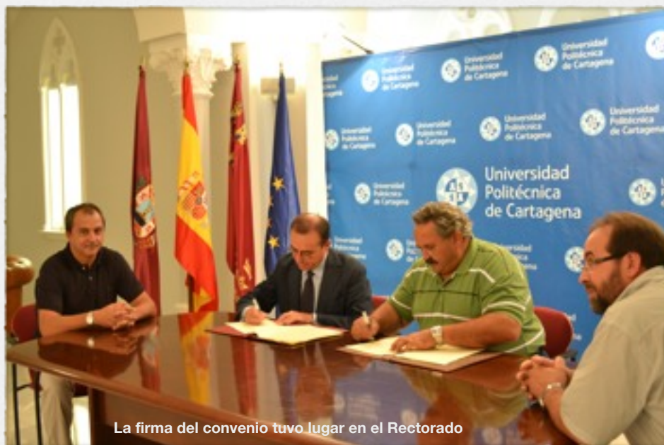
La firma del convenio tuvo lugar en el Rectorado

El convenio también contempla la promoción de la mejora tecnológica dentro del sector ovino y caprino de leche y de carne del Campo de Cartagena, ya que se trata de un sector productivo con un