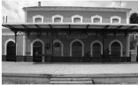
Figura 5: Apeadero de Agost. Propuesta de revitalización.