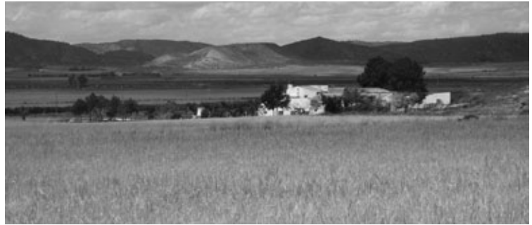
Figura 7: Vista del paisaje alicantino, a su paso por la huerta de Villena.

Para proyectar la Vía al Mediterráneo comenzamos concretando el ámbito de su área de estudio territorial y paisajístico, es decir, delimitando su extensión geográfica. La comprensión