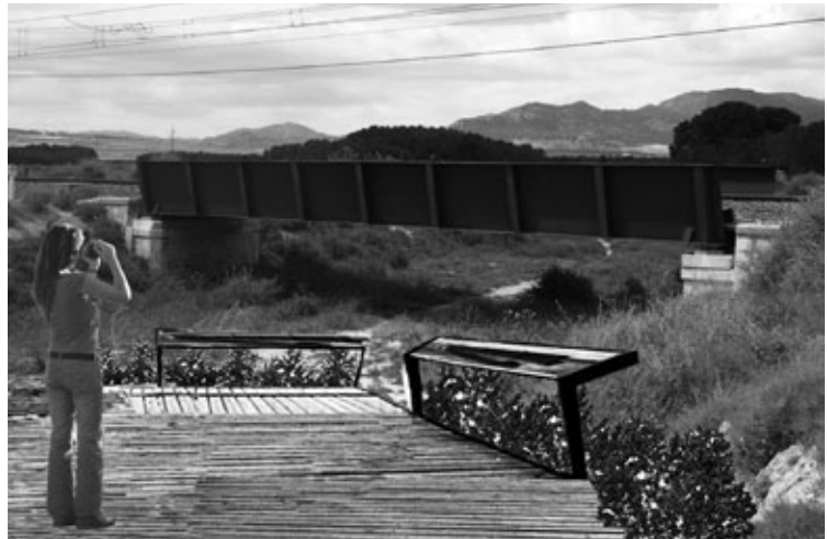
Figura 23: Diseño de mirador, cerca del puente de La Algueña, en Villena. Aunque no se tratan de barreras físicas que impidan el paso, los miradores constituyen barreras visuales, que señalizan el límite del recorrido para el visitante en las proximidades de la obra.

La falta de puesta en valor del paisaje territorial alicantino, a pesar del gran potencial que tiene