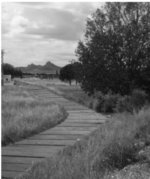
Figura 16: Mirador.