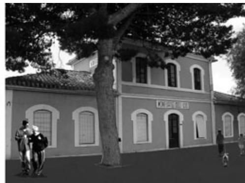
Figura 19: Estación de Monforte del Cid y posible transformación (rehabilitación).