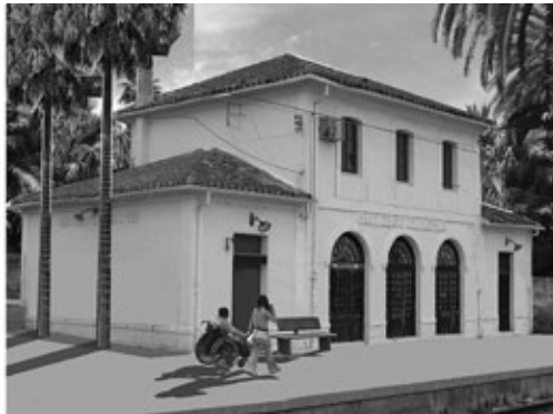
Figura 18: Estación de San Vicent del Raspeig y posible transformación (rehabilitación).