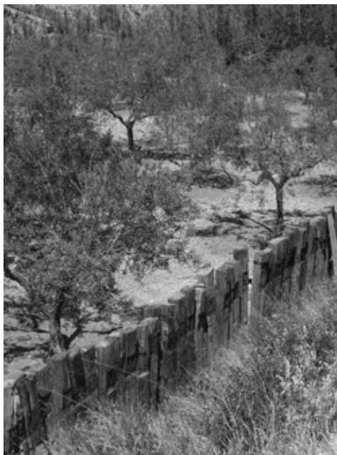
Figura 12: Vista del paisaje desde el puente sobre las vías en el antiguo apeadero de Santa Eulalia.