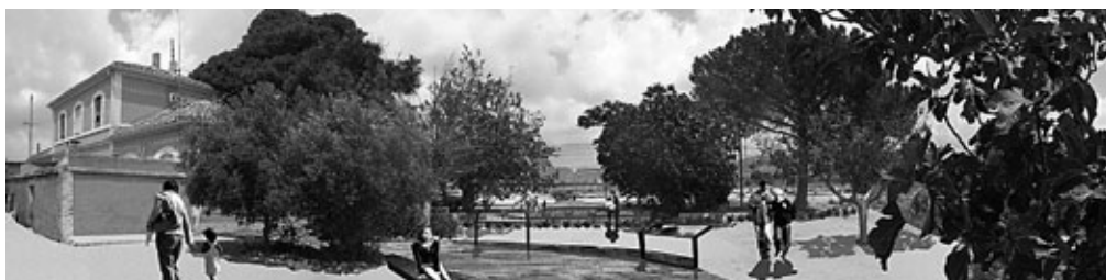
Figura 20: Diseño de los alrededores de la estación de Monforte del Cid.