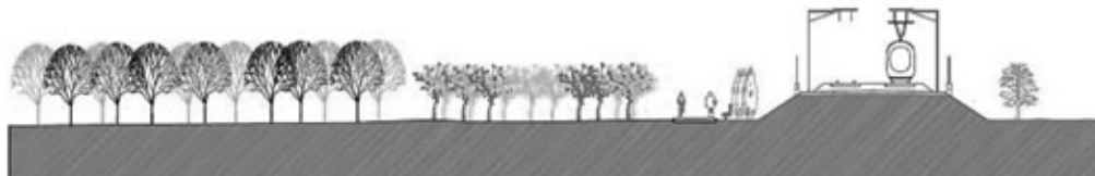
Figura 8: Esquema de diseño del camino en relación a las vías del ferrocarril.

Es necesario, por tanto, recordar que la Vía al Mediterráneo atraviesa múltiples áreas que se pueden agrupar en tres grupos diferenciados: zona urbana, zona interurbana y zona agrícola o de interés paisajístico. Desde el punto de vista de los ecosistemas, la Vía al Mediterráneo abarca desde las montañas del interior hasta las playas de la costa: desde el sistema forestal de las montañas del interior, pasando por las salinas, los espacios cultivados, los marjales de los ríos, hasta el terreno calcáreo y pedregoso, carente de vegetación, de los alrededores de la ciudad de Alicante.