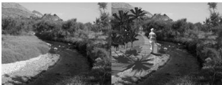
Figura 11: Propuesta de diseño de la Vía al Mediterráneo, en las cercanías del río Vinalopó.

Son aquellos puntos o lugares que nos permiten tener una visión conjunta del paisaje y desde los cuales podemos percibir una visión amplia del territorio. Están constituidos por los lugares de cierta elevación desde donde podemos visualizar hacia la lejanía. Estos son: paisaje desde el puente del Camino del Olmillo sobre las vías del tren -Villena-; paisaje desde el puente sobre el Apeadero de la Colonia de Santa Eulalia -Sax- (Figura 12); paisaje desde el puente sobre las vías del tren, antes del puente sobre el Vinalopó -Elda-; paisaje desde el Castillo de la Mola -No-