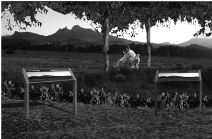
Figura 25: Diseño de zona con paneles informativos.