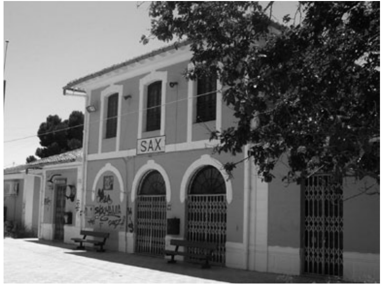
Figura 3: Estación de Sax.

El ingeniero Agustín Elcoro Bercébar realizó en 1852 el proyecto de las estaciones de ferrocarril