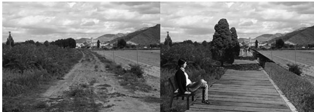
Figura 24: Propuesta de camino Villena y Sax.

Una buena forma, por tanto, de poner en valor el paisaje territorial junto con el patrimonial, sería la de llevar a cabo la limpieza y adecuación de los caminos, la señalística adecuada (Figura 25), la rehabilitación del patrimonio ferroviario y de su entorno inmediato, y una publicidad orientada a atraer un turismo alternativo que le devuelva al territorio alicantino un tanto de la importancia que tuvo en otras épocas de la historia.