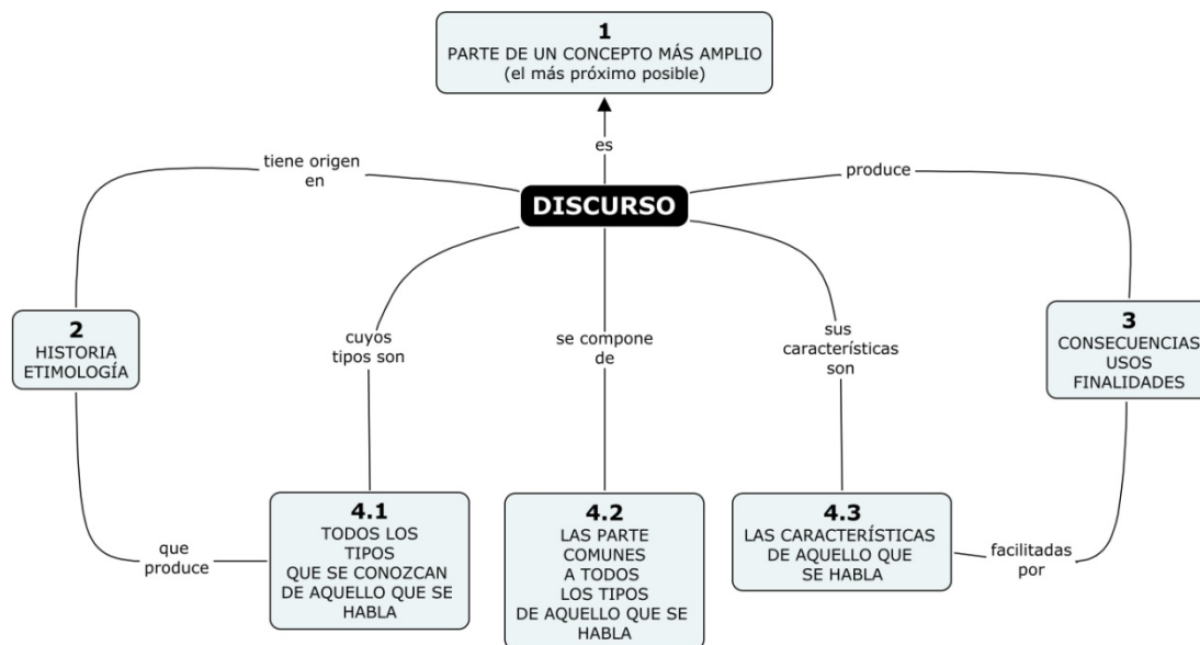
Figura 3. De Garrido, A. (2012)