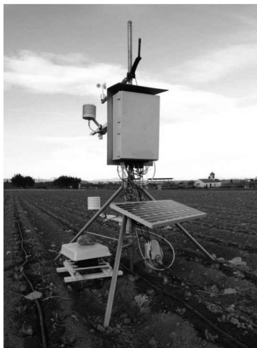
Figura 1. Equipo RBBE instalado en finca experimental sobre cultivo de lechuga.

El método RBBE requiere calcular la energía disponible ( R_n - G ) y los gradientes de temperatura y humedad sobre el cultivo. Los gradientes fueron evaluados con sensores en dos brazos, dispuestos en el sentido de la hilera de plantas y separados 1,10 m entre sí. El brazo inferior se ubicó 50 cm sobre el suelo. El gradiente de temperatura se evaluó con dos termopares de hilo fino tipo E (cromo-constantán) de 76 \mu\text{m} de diámetro, aspirados y protegidos de la radiación directa. A su vez, el gradiente de humedad se comprobó mediante un espejo de punto de rocío ALMEMO® tipo FHA64DTC1 (Ahlborn Mess. und R., Alemania), compartido por ambos brazos y alimentado alternativamente desde cada altura mediante dos bombas independientes.