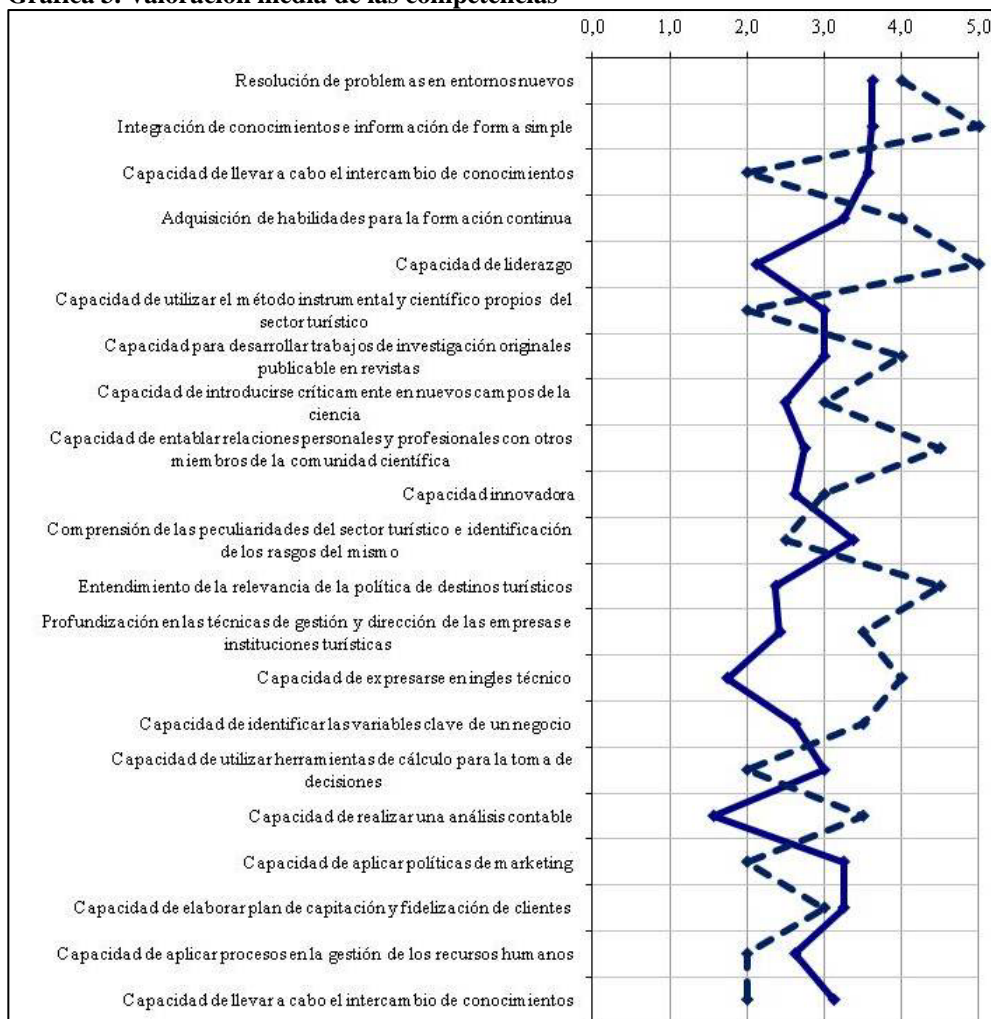
Gráfica 3. Valoración media de las competencias

Nota: En trazo continuo: Contribución del Máster al desarrollo de las competencias. Trazo discontinuo: Nivel de competencias necesarias en el trabajo actual.